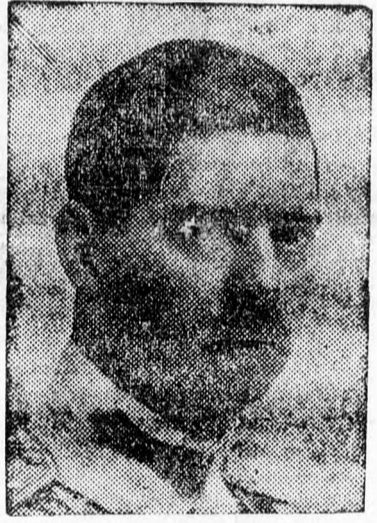
Ófelsége II. Károly király

Nem fogjuk fel úgy a multat, hogy annak a törvényhozó módszerei és alkotásai érdemtelenné lettek volna. Ellenkezőleg. Azokban is megvolt az idők követelményeinek a szolgálata, s azok nélkül nem is jöhettek volna létre a