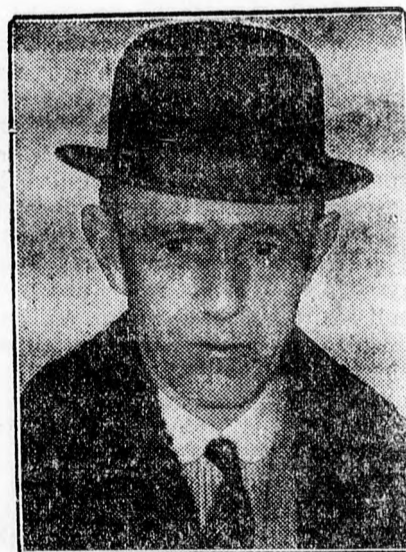
Lord Halifax, akit Eden angol külügyminiszter utódjául emlegettek.