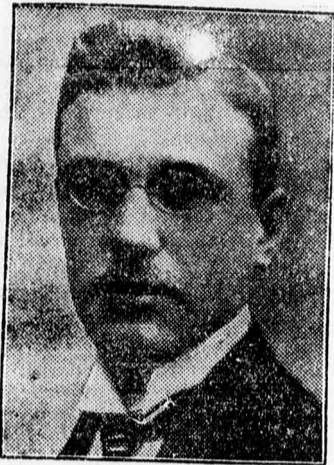
Dr. Seyss-Inquart Artur

Bécsből jelentik: A gráci és középstájerországi nemzeti szociálisták vasárnap gyűlést akartak tartani a Hazafias Arcvonal keretein belül. Miután hatósági részről föltételezték, hogy a nemzeti szociálisták így a Hazafias Arcvonal leple alatt csak a maguk tiltott gyűlése-