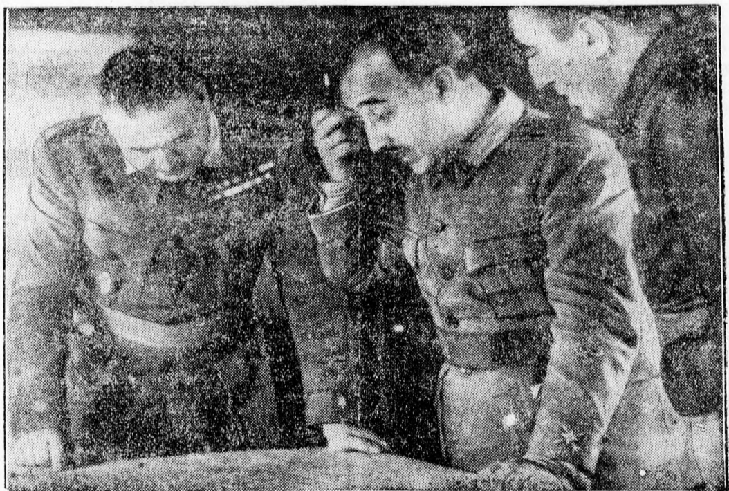
Francó tábornok és munkatársai a terueli hadszíntéren. A spanyol nemzeti csapatok a napokban elfoglalták Teruel, amelyet a vörös csapatok — a város elhagyása előtt — romhalmazzá változtattak. Képünkön Franco, a nemzeti Spanyolország államfője látható, amint a terueli fronton tábornokaival megbeszélést folytat.

nia és Jugoszlávia már elismerték az olasz császárságot, s Törökország és Görögország is rövidesen alkalmazkodni fognak ehhez a lépéshez. A szövetség tagállamai végül bejelentik, hogy gazdasági érdekeik biztosítása céljából kapcsolatba lépnek Franco tábornok kormányával.