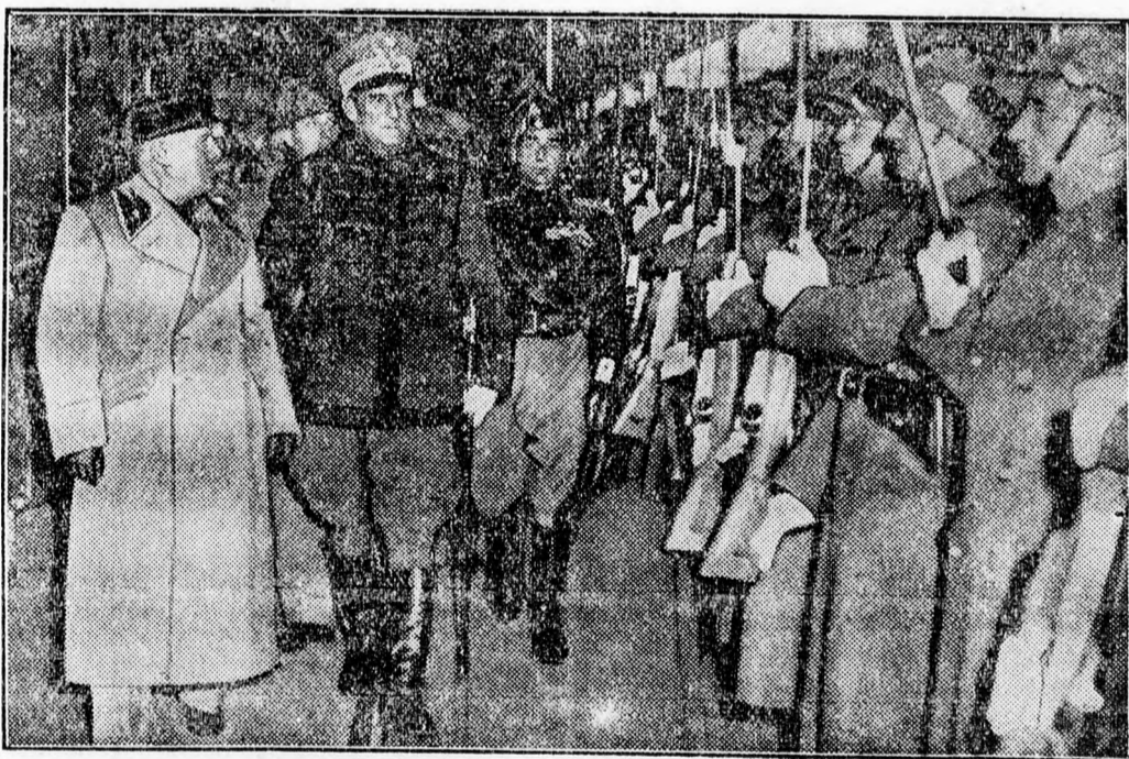
Graziani marsall, Abesszinia alkirálya visszaérkezett Rómába, ahol a pályaudvaron maga a Duce várta. Mussolini és Graziani elvonultak a diszszázad előtt. Képünk erről az aktusról készült.