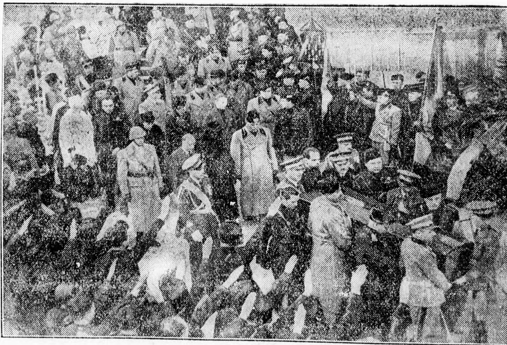
D'Annunzio temetése nagy pompával ment végbe a Garda-tó mellett levő Gardonében. A koporsó mögött D'Annunzio özvegye, Montenevoso hercegnő és Mussolini haladnak.

A közeledésnek azonban vannak nehézségei is a fennálló szerződések egyes pontjai miatt. Az ezekről való tárgyalás rendkívül kényes és csak magas műveltségű népek között lehetséges. Mistler leszögezi még, hogy a három állam közötti együttműködésnek nem lesz szabad Németország ellen irányulnia, sőt meg kell találni Németországgal is a szorosabb kapcsolatot. Ugyanakkor kívánatosnak tartja a francia politikus a három ország számára az Olaszországgal való barátság megőrzését is.