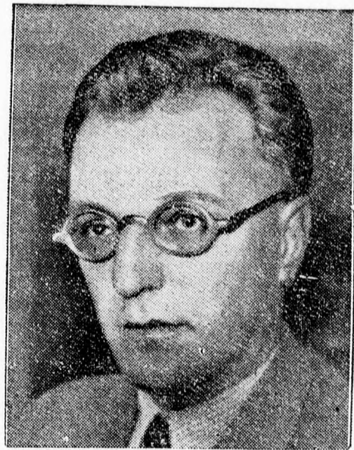
Dr Seyss-Inquart, Ausztria új kancellárja.