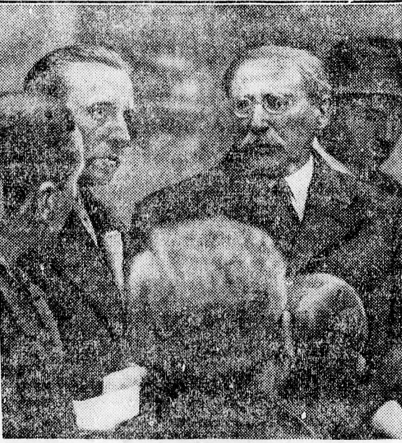
Elum Leon francia miniszterelnök az újságírók kérdéseinek pergőtűzében.

Rejtélyes eredetű barlanglakást fedeztek fel az erdőben. Simleul-Silvaniei. Saját tud. Érdekes felfedezést tett az elmúlt napokban két tusai lakos a község határában lévő erdőben. Amint az erdő egyik elhagyatott részén áthaladtak, egy ágakkal befedett üreget fedeztek fel s amikor a galyakat kíváncsiságból eltakarították, lépcsőkre bukkantak. Erthető érdeklődéssel mentek le a láthatólag hosszú évek óta nem használt lépcsőkön s egy tágas és kényelmes földalatti lakásba értek. Az érdekes barlang két személyre volt berendezve, két ágy, székek, asztal és kemence van benne. Nem lehet tudni, hogy a mintegy 40—50 évvel ezelőtt készült földalatti lakást valami büntetés elől bujdosó gonosztevő, szökött fegyver vagy valami másfajta erdei emberek lakták-e. Létezéséről mindeddig senki sem tudott.