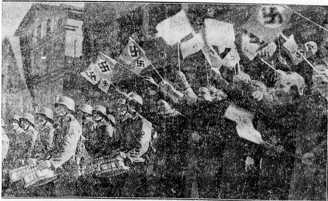
Kufsteinban katonazenével, német és horogkeresztos zászlókkal várták a bevonuló német csapatot. Képünk a Kufstein főterén készült az ott várakozó osztrák ickolásgyerekek és a katonaj zenekar egy csoportjáról.

— Nekünk, fasisztáknak, minden határunk szent, — mondotta Mussolini. — A határok felől nem vitatkozunk, azokat megvédjük. Amikor az osztrák dráma az elmúlt napokban elérkezett ötödik felvonásához, a fasiszták ellenségei azt híresztelték, hogy a két tekintélyuralmi állam barátságát a határvillogások majd megdöntik. Ez új világháború veszélyét idézte volna fel. Ez a számítás téves, gyermeki remény volt. A demokráciák játéka balul ütött ki. A németek — és közülük is sokan hallgatták ezt a beszédet, — tudják, hogy a Berlin-Róma tengely nem diplomáciai alkotás, mely csak normális időkben állja meg a helyét, hanem olyan erő, amely rendkívüli időben is kipróbálta már erejét, nemcsak a német politikában, hanem az európai politika történetében is. A Berlin-Róma tengely kapcsolata soha nem volt olyan erős, mint most. A két állam egymás mellett lépdel, hogy végre egyensúlyt biztosítson ennek a sokat szenvedett földrésznek, hogy lehetővé tegye minden nép békés együttélését.