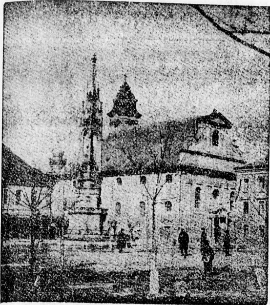
A piaristák régi timisoarai temploma

Nines szándékunkban foglalkozni Timisoara múltjával, annyi azonban megállapítást nyert, hogy már 1203-ban a város falai közé te-