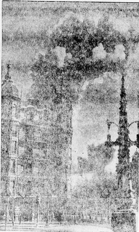
A BOMBÁZOTT BARCELONA