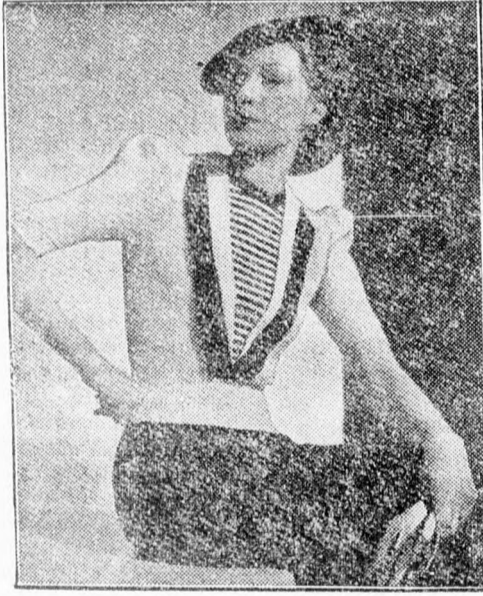
Bájos tavaszi bluz:

fehér kötött anyagból, amelybe kékcsíkos mellény van belekötve, ami külön trikó benyomását kelti.