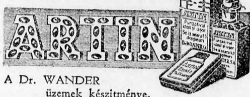
A Dr. WANDER üzemek készítménye.