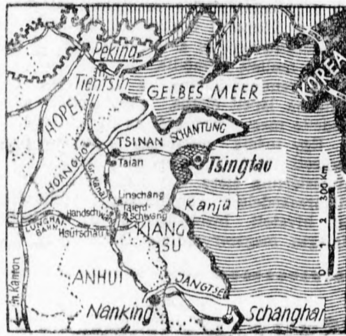
A kínai-japán háború a Tsingtau-Tientsin szakaszon kitört. A térkép felső részén jól ki- vehető a híres kínai fal vonala is.