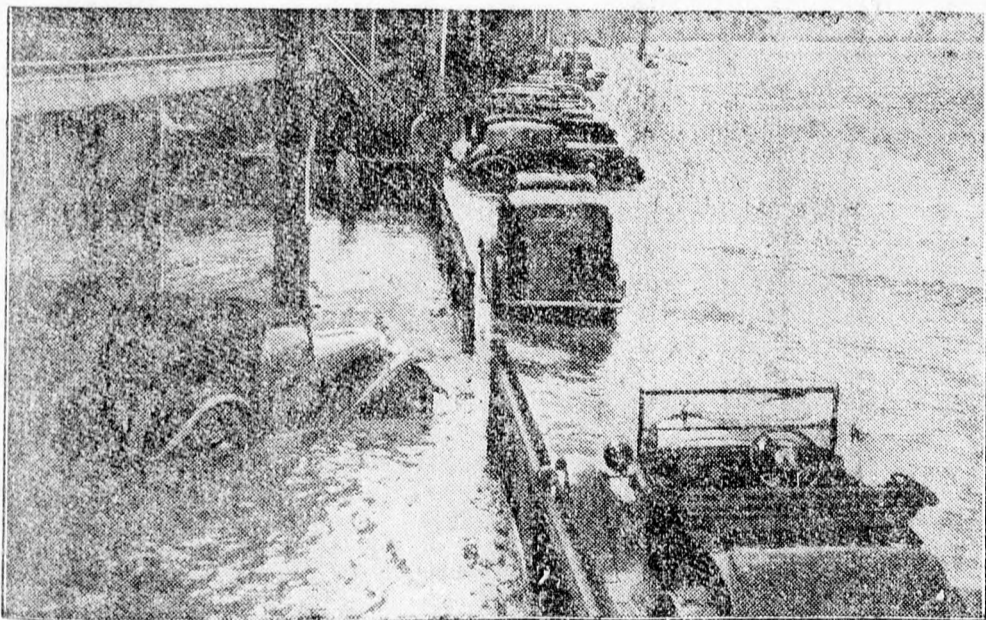
London környékén hatalmas áradások voltak. Képünk London mellett, Fulneynél a Themze áradásáról és a biztonságba helyezett autókról készült.

Terv az állami és köztisztviselők egységes tüzfűtőellátására. Cluj. Saját tud. A Caps központi igazgatósága tervezetet dolgozott ki az állami és köztisztviselők, megyei és városi intézmények egységes tüzfűtőellátására vonatkozólag. A terv szerint a beszerzést az árak olcsóbbá váló tetele végett kerületenként végzik olyképpen, hogy az illető kerületbe tartozó köztisztviselők és hatóságok tüzfűtőellátását összesítve írják ki árlejtésre. Az egyik ilyen kerületi beszerzési központ Clujon fog működni.