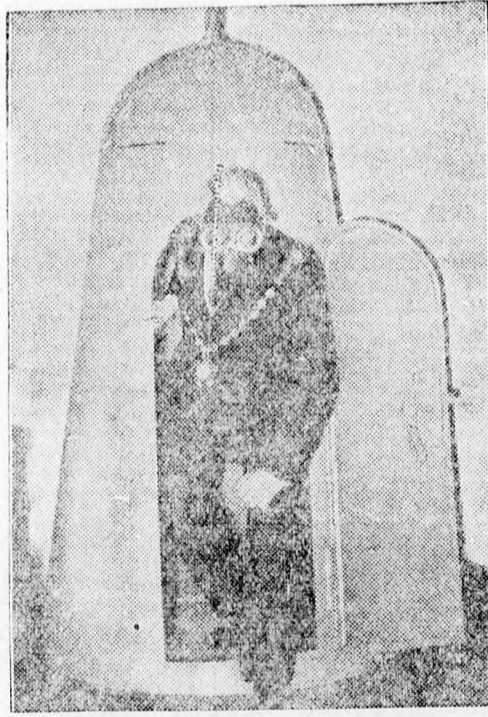
Londonban légi támadások ellen való felszerelésekből kiállítás rendeztek. A képünkön látható „kabin” egy gázmentes felke, amit utcákon fel lehet állítani a gőztámadás esetén menedéket nyújt.

Bucuresti. Saját tud. Vasárnap folytatják Constanta mellett a nyílt tengeren a német és volt osztrák alattvalók népszavazását. A szavazás a „Chios” és a „Salia” nevű hajókon fog történni. Két különvonattal mintegy kétezer szavazó fog Constantába érkezni. Az egyik vonat reggel hétkor érkezik Moldva felől, a másik pedig délben 12-kor Bucuresti felől. A szavazás egyébként ugyanúgy fog lefolyni, mint a múlt héten.