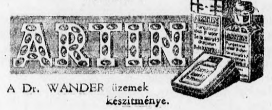
A Dr. WANDER üzemek készítménye.