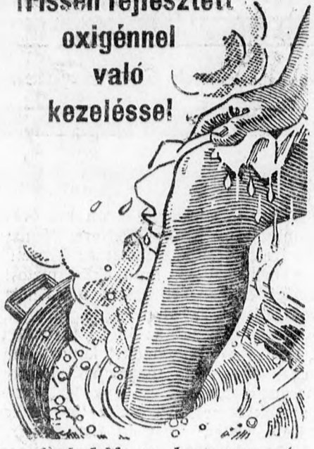
Oldja a hűgysavat.

Áztasson be egy darab finom vásznat, nagyon forró, saltrates vízbe és nyomja rá, többször egymásután, a fájó testrésze. A frissen fejlesztett oxigén, amely a Saltrates Rodell-ből felszabadul, mélyen behatol a pórusokba, és elősegíti, a tühegyességi és borotvaélességi kis hűgysavkristályok eltávolítását. A fájdalomnak — csodálatos módon — azonnal megszűnnek. A saltrates láb-fürdőben megszűnnek a láb-fájdalmak. A tyukszemek annyira felpuhulnak, hogy pusztá kézzel eltávolíthatók. Órákon át járhat, táncolhat kényelmesen. A Saltrates Rodell-t minden gyógyszerár és drogéria árusítja.