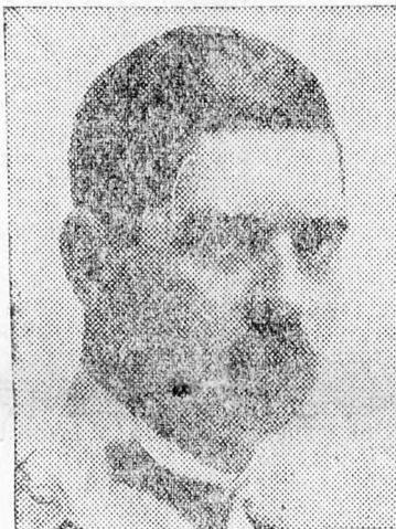
Ófelsége II. Károly király