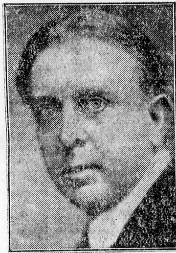
Dr. Goga Octavian, a váratlanul elhunyt költő és politikus

Bucuresti. Saját tud. Éjfél után háromnegyed egy órakor érkezett meg Bucurestibe