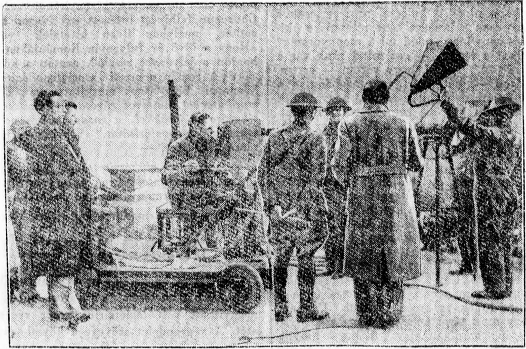
Angliában minden eszközt felhasználnak a hadsereg fejlesztésére. Így most a rádió mellett a távolbalató készüléket is az ifjuság toborzására használják fel

És ugyanilyen a török és japán szórend is.