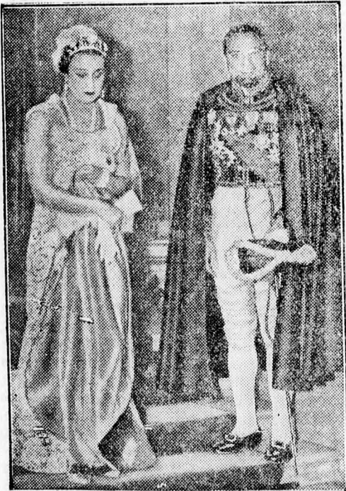
Az angol királyi pár fogadónapja minden évben társadalmi esemény Londonban. A diplomaták fényes egyenruhái és a hölgyek elegáns divat-kreációi színessé teszik ezeket a fogadó-estéket. Képviselet gróf Grandi olasz követ és a felesége láthatók, a Buckingham palota előtt.

Kávéházakban, vendéglőkben kérje mindenütt a „MAGYAR LAPOK”-at.