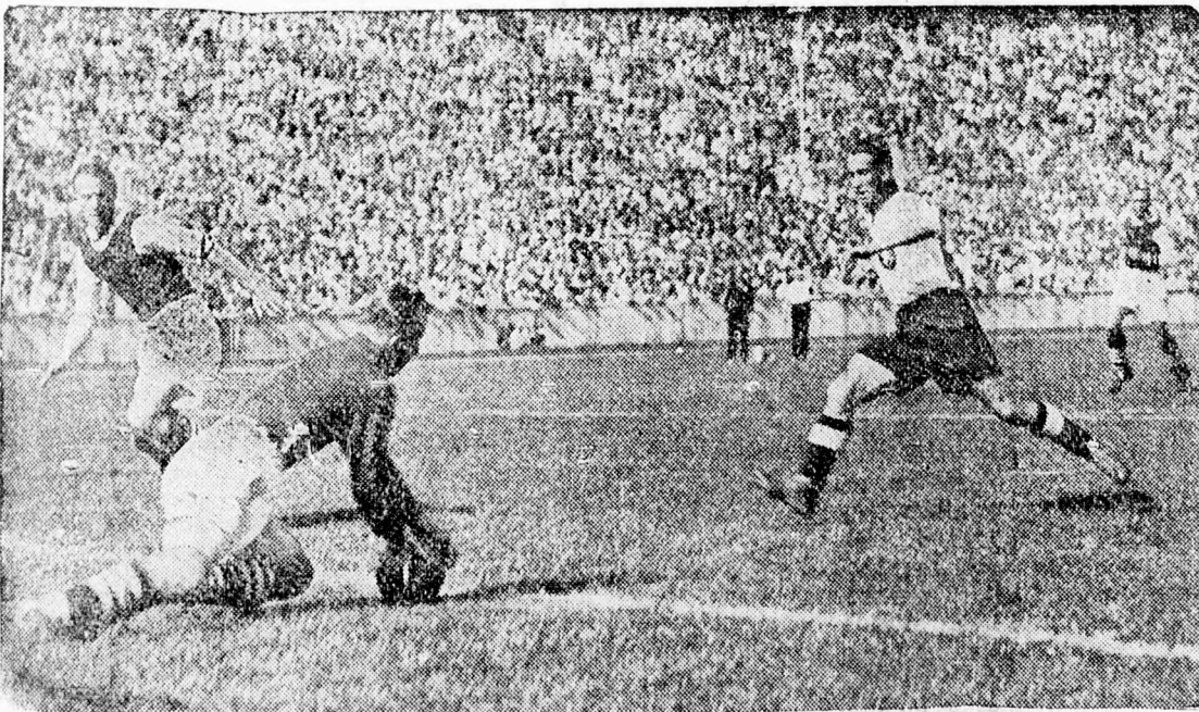
Legalmas jelenet az Aston Villa—Wien berlini mérkőzésén, amely 3:2 eredménnyel végződött.

Rómából jelentik: Illetékes körök hivatalosan kijelentik, hogy az olasz—francia tárgyalások rendes mederben folynak. Hivatalos jelentés szerint meg kell cáfolni azokat a híreszteléseket, melyek szerint a nemzetközi helyzetben állítólag súlyos feszültség állott volna be.