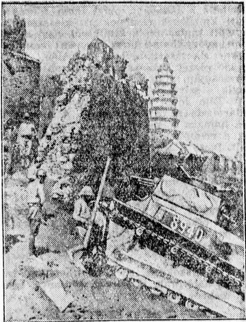
A kínai fal sem akadály többé.

A most dúló japán—kínai háború során a kínai fal, mely évszázadokon át a legfontosabb katonai erősség volt, nem akadály többé a modern harci eszközök számára. Ahol gránátalálat folytán rés támad, a tankok nyomban megkezdik előnyomulásukat.