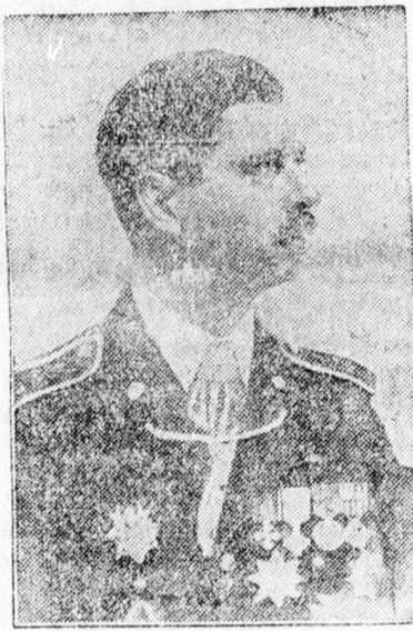
Őfelsége II. Károly király

szélt a király, amely a munka és a hit alapjaira épült. Új szabadság adatott az országnak: a fegyelmettség szabadsága, amely a haladás kövöszája. Nem maradhat meg a jövőben az