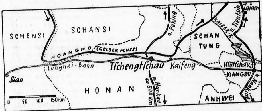
A japán csapatok közvetlenül Csengcsau előtt állnak. Legujabb jelentések szerint a japánok a Lunghai-vasutvonal mentén egészen Csengcsauig nyomultak elő, mely igen fontos csomópont. Innen tovább nyomulnak Hankau felé, ahonnan már eltávozott a polgári lakosság.

400 kilométernyire. Azóta ez az oldalról előtörő haderő továbbhaladt nyugat felé s 13-án elfoglalta a folyó balpartján Anking várost, a középkínai Anwei tartomány székvárosát. Innen légvonalban 180 kilométerre van Hankau.