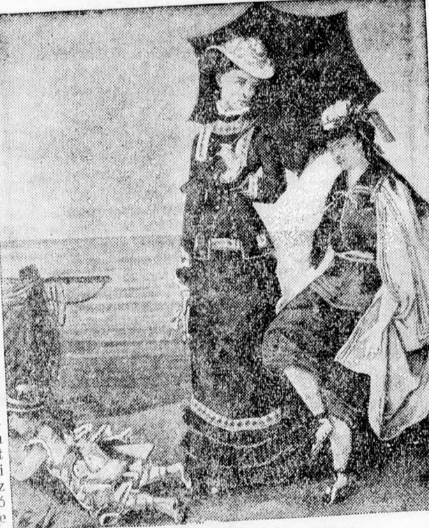
60 év előtt így mentek fürdőni.