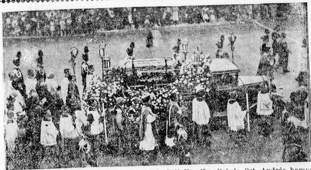
Lengyelország védőszentjének átszállítása Rómából Varsóba. Bobola Szt. András hamvait tudvalevően Rómából Varsóba szállították. Bobola Andrást Lengyelország védőszentjének nyilvánították. Képünk a szent földi maradványainak a római pályaudvarra való ünnepélyes átszállítását mutatja

niszter. A megvitatásra került kérdések között értesülésünk szerint szerepelt a kisebbségi kérdés is, amely egyébként az utóbbi időben minden minisztertanácson és miniszteri értekezleten beható megbeszélés tárgyát képezi.