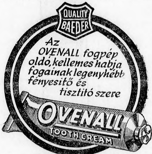
A HABZÓ FOGPÉP

— A haditerületekre eső kikötőkben csak akkor tudnánk hajóink védelmét biztosítani,