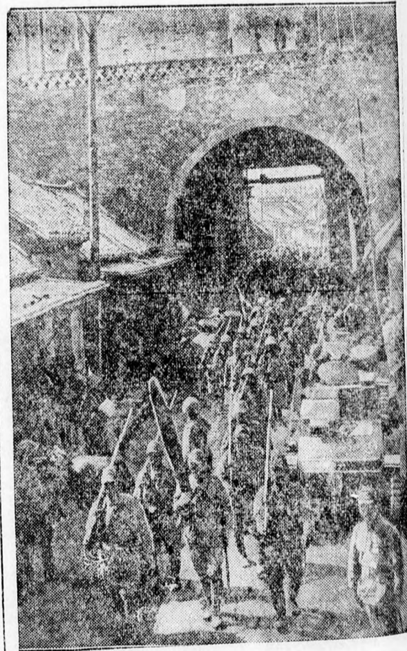
A győzelmes japán csapatok bevonulása Hszücsauba.

Hitler bécsi útjáról hivatalosan azt jelentik, hogy a német birodalmi kancellár a birodalmi színházi hét utolsó előadásán akar résztvenni; de sokan kommentálják azt a napi-parancsot is, amelyet csütörtökön reggel tettek köze és amelyben Hitler elismerését és köszönetét nyilvánítja hősi magatartásukért a régi osztrák nemzeti-szocialistáknak. A Daily Express és az Evening Standard, valamint a Reuter szerint érdekes politikai háttér van Hitler bécsi utazásának és az állítólag Seyss-Inquart birodalmi helytartó kezdeményezésére történt