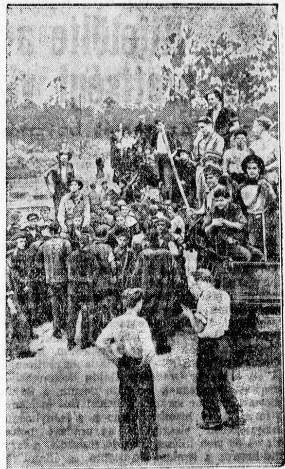
Amerika mozgósít a gyermekrablók ellen.

* Aranyérmét és béldugulást, valamint az ezekkel járó derékfájás, mellszorulás, szivdobbogás és szédülési rohamok esetén reggelenként egy-egy pohár természetes „Ferenc József” keserűviz csakhamar kellemes meglkönnyebbülést eredményez. Kérdezze meg orvosát.