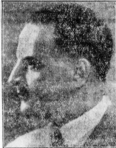
Ghelmegeanu közlekedésügyi miniszter.

Eddig azonban csak ígérek és üres szavak hangoztak el. Ghelmegeanu közlekedésügyi miniszter munkája új fejezetet jelent. A minisz-