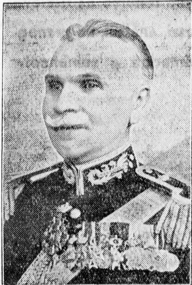
Argeseanu tábornok, nemzetnevelésügyi miniszter.

Bucurestiből jelentik: Minden állam katonai vezetőit most a felfegyverkezés gondolata foglalkoztatja. A legtöbb államban folyik is a föl-