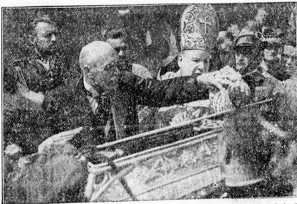
Lengyelország ünnepi védőszentjét, Lengyelországban nagy ünnepek voltak Bobola Szent András tiszteletére. Képünk azt a jelenetet örökíti meg, amikor Moscicki elnök a hamvakat tartalmazó koporsón elhelyezi a függetlenségi keresztet

A régi törvény második fejezetét az új törvény teljesen hatályon kívül helyezi. Ennek következtében megszűnnek az összes ellenőrző, irányító és szervező Uniók, ezeket a jogokat jövőben kizárólag az újonnan létesített Nemzeti Szövetkezeti Intézet gyakorolja. Ennek az intézetnek ez a hatásköre kiterjed minden olyan társaságnak az ellenőrzésére és irányítására, amely szövetkezeti, vagy kölcsönöségi elveken nyugszik, kivéve a közbirtokosságok felett gyakorolt ellenőrzési jogokat, amely a földművelésügyi minisztérium hatáskörébe utaltatik vissza. A Nemzeti Szövetkezeti Intézet az eddig működött öt legfőbb szövetkezeti központnak, tehát a Központi Szövetkezeti Banknak, a Mezőgazdasági Beszerző és Értékesítő Szövetkezetek Központjának, a Fogyasztási Szövetkezetek Központjának, a Szövetkezetek Központi Intézetének és az Ellenőrző, Szervező és Irányító Központi Szövetkezetnek fúziója által jön létre. Ez a fúzió megtörténtnek tekintetik az új törvény kihirdetése által, minden további formai betöltése nélkül. A Nemzetgazdasági