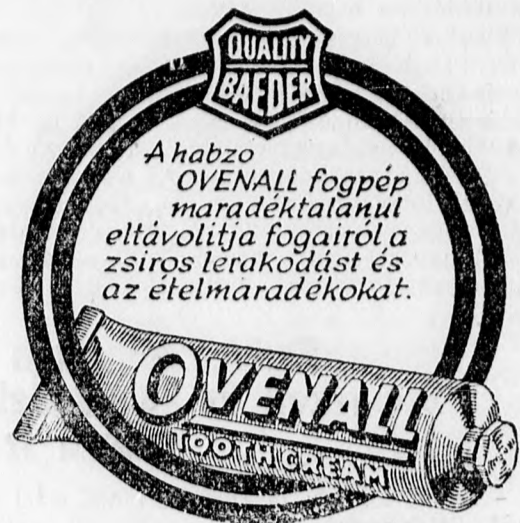
A HABZO FOGPÉP

új alakulást csak a Szövetkezeti Nemzeti Hivatal hagyhat jóvá. Új szövetkezetek alakítása alkalmával tehát ehhez az intézethez kell felküldeni 5 példányban az alapszabályokat, valamint a jegyzett üzletrész 10 százalékának lefizetését igazoló nyugtát. A 4 § szerint a szövetkezetek igazgatóságába elsősorban olyanok választandók be, akiknek nincsen tartozásuk egy szövetkezettel sem. Semmiesetre sem választhatók be azok, akik korábban bármi ok miatt fegyelmi úton valamelyik szövetkezet éléről el lettek távolítva. A 7 § kimondja, hogy a szövetkezetek évi mérlegét csak akkor lehet közgyűlés elé terjeszteni, ha azt a Nemzeti Szövetkezeti Hivatal ellenőre előzetesen látta-mozta. A 8. § szerint a szövetkezetek felügyelőbizottságába olyan tagok választandók be, akik