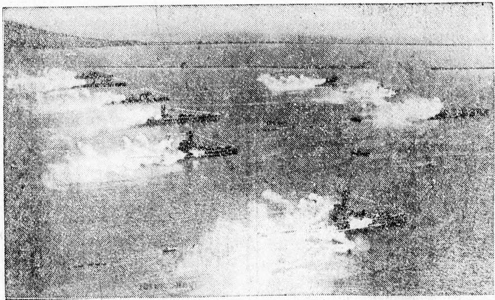
A hajóraj üdvözlölte VI. György királynak