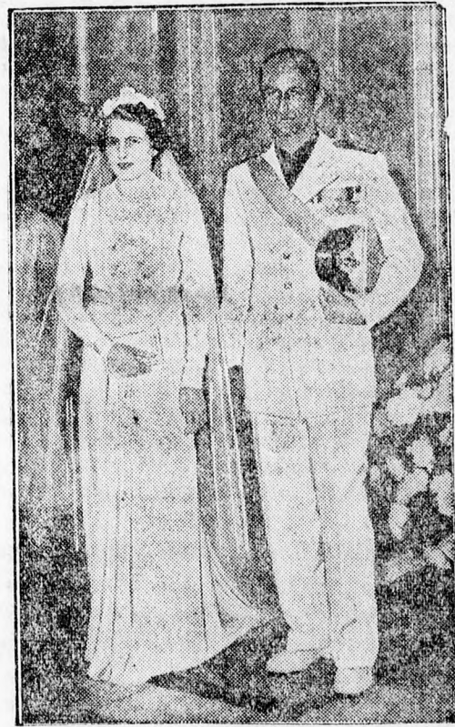
Marconi leánya férjhez ment