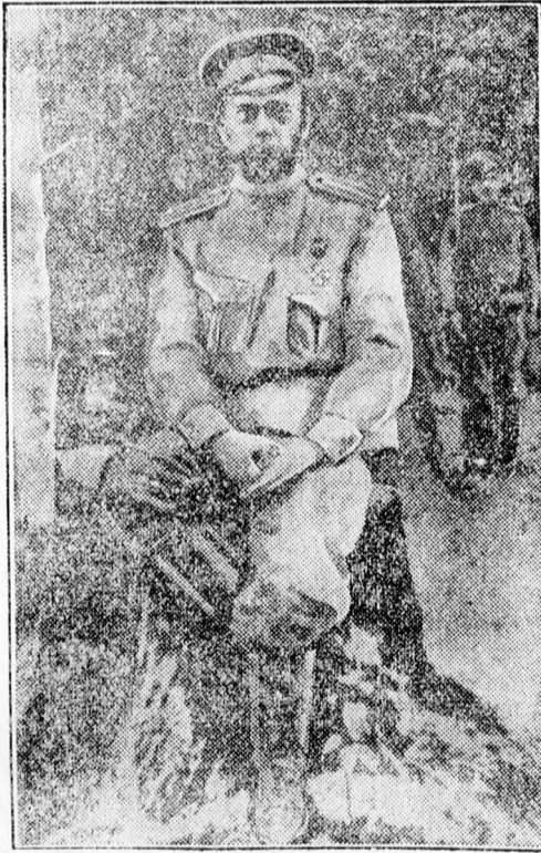
II. Miklós orosz cár egyik legutolsó fényképe.

család többi tagjait is lemészárolták a bolsevisták. Valóságos vérfürdőt rendeztek Jekaterinburgban, ahol sortűzek dördültek s a vértől, gyilkolástól megmámorosodott vörösök nem ismertek kíméletet. Ennek dacára, a huszas évek elején, sőt később is, főleg a Párizsba emigrált oroszok között fel-felbukkant egy-egy volt orosz nagyhercegnő. És az a hír, hogy Tatjana és Anastasia nagyhercegnők csodálatos módon megmenekültek a vérfürdőből, — sokáig tartotta magát. Azonban mindig kiderült, hogy a magukat nagyhercegeknek, vagy nagyhercegnőknek mondó „menekültek” ügyes szélhámosok. Az orosz cár és családjának tagjai ott pusztultak el a húsz év előtti vérfürdőben.