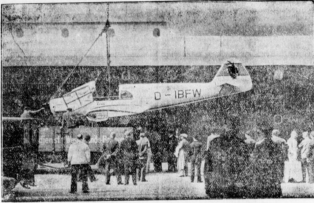
Otto Brindlinger német repülő, kíséreléssel, Horst von Salomonnal és Stöling Inge asszonnyal megérkeztek 7 hónapos délamerikai utjukról, ahol „Taifun” nevű repülőgépjükkel járták be a földrészt. A sikeres repülőút után kihajózzák a Bremen óceánjáróból a „Taifunt”.

Zürichi zárlat. Párizs 12.06, London 21.48 fél, Newyork 437.12, Brüsszel 73.92 fél, Milánó 23, Amsterdam 240 egynyelcad, Berlin 175.45, Prága 15.10, Varsó 82.40, Belgrád 10, București 325.