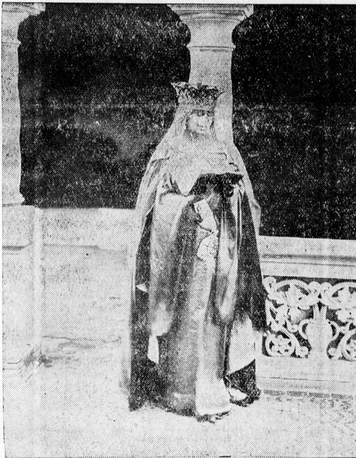
ÓFELSÉGE MÁRIA KIRÁLYNÉ † (A koronázás napján készült fényképfelvétel).

Budapestről jelentik: Vasárnap délben 12 órakor a budai Döbrentei-téri görögkeleti templomban istentisztelet lesz Mária anyakirályné lelkiüdvéért.