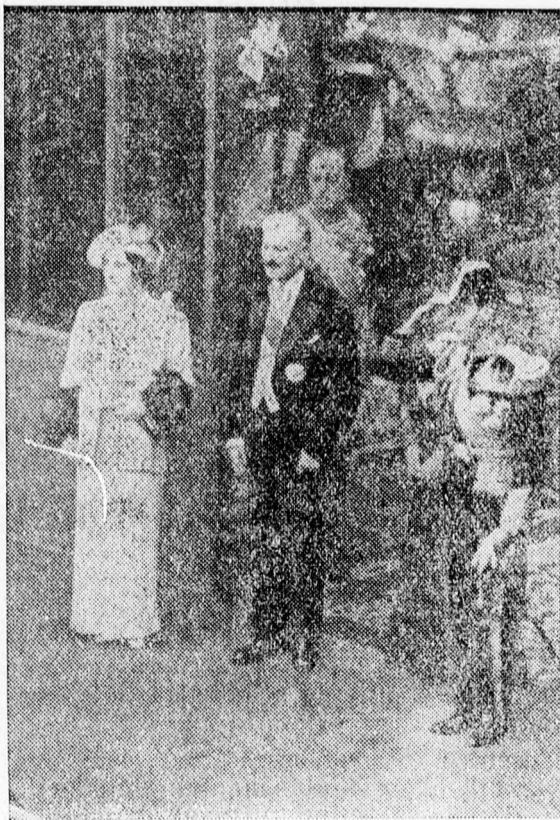
Az angol királyi párt Lebrun, a francia köztársaság elnöke fogadta az elnöki palota előtt.

PÁLYÁZATI HIRDETÉS. A zălaui (jud. Sălaj) református Wesselényi-kollégium előjárósága az 1938—39. évre pályázatot hirdet a következő helyettes tanári állásokra: 1. fizikakémia; 2. latin tanszékre. Pályázati határidő 1938. július 31.