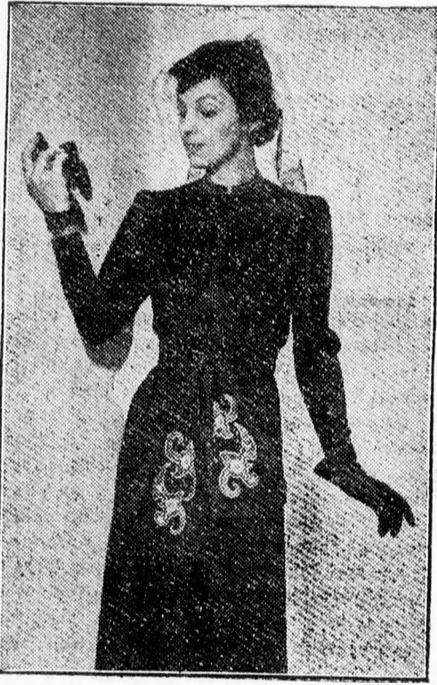
Fekete selyem ruha, széles selyem sál-övével, amelynek a szélén színes himzés van. A nyaknál szintén keskeny, himzett csík.

színű, mint a csíkos flanelből készült kosztümezt favorizálja a divatos dáma.