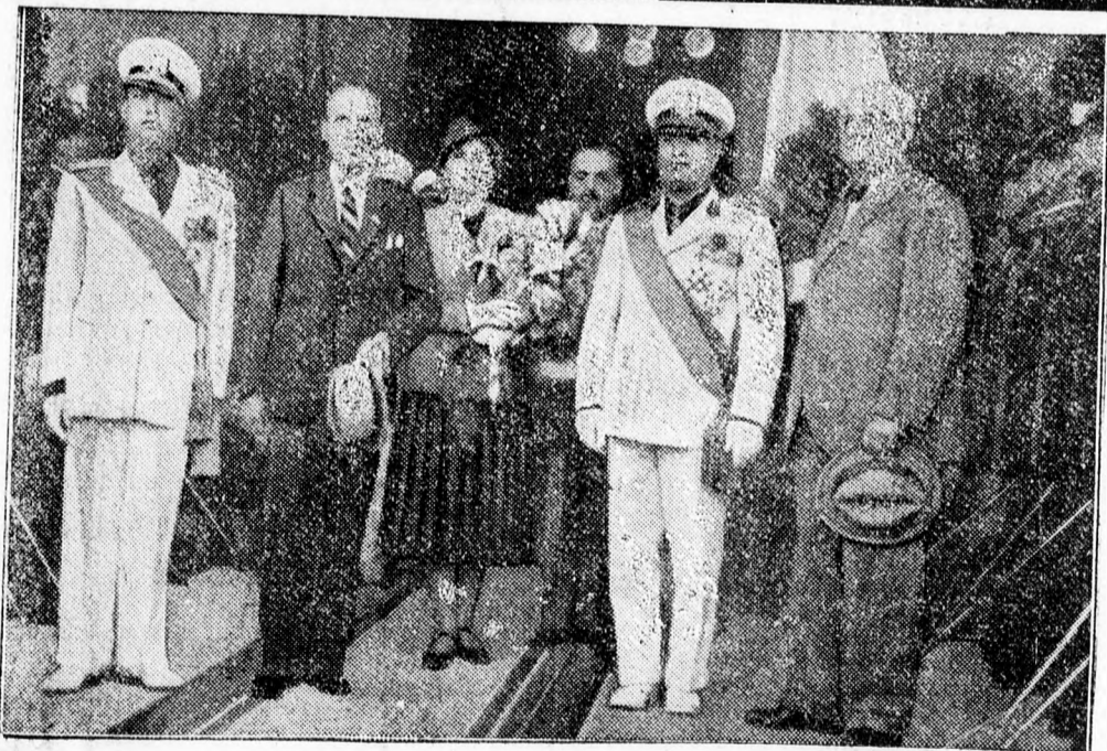
Kép az olasz-magyar találkozóóról. Balról jobbra: Ciano olasz külügyminiszter, Imrédy magyar miniszterelnök, Imrédy felesége, Mussolini és dr. Kánya Kálmán magyar külügyminiszter.

Pozsonyból jelentik: Az Egyesült Országos Keresztény-szocialista és Magyar Nemzeti Párt törvényhozó tartománygyűlési képviselői pénteken közös tanácsulést tartottak Pozsonyban. Az ülésen Szűllő Géza nagy beszédet mondott az időszerű cseh problémákról. Beszédében a