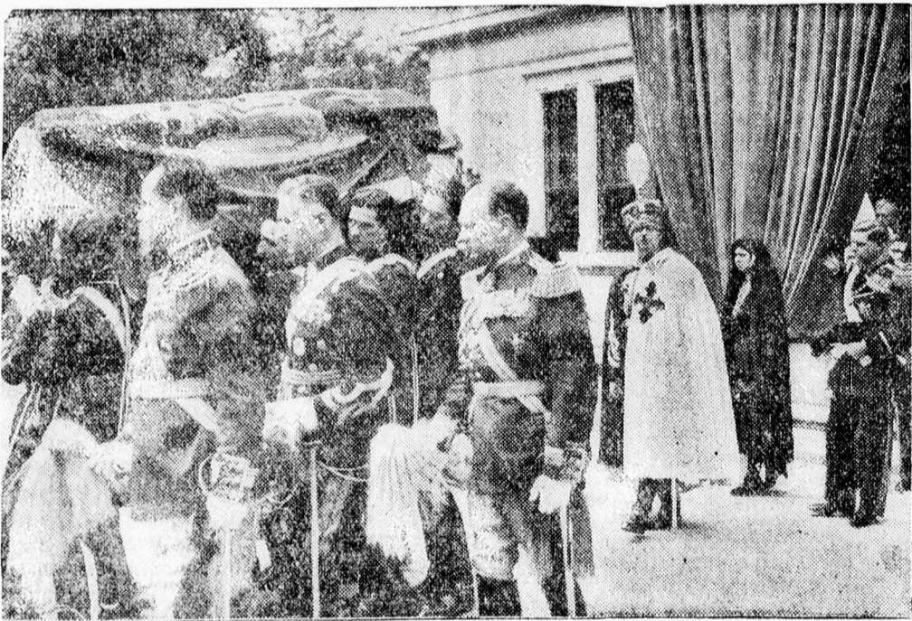
Mária királynő koporsóját a négyes lovasezred tisztjei vállukon viszik ki a cotroceni palotából. A koporsó mögött II. Károly király, Miklós herceg és a királyi család többi tagjai láthatók