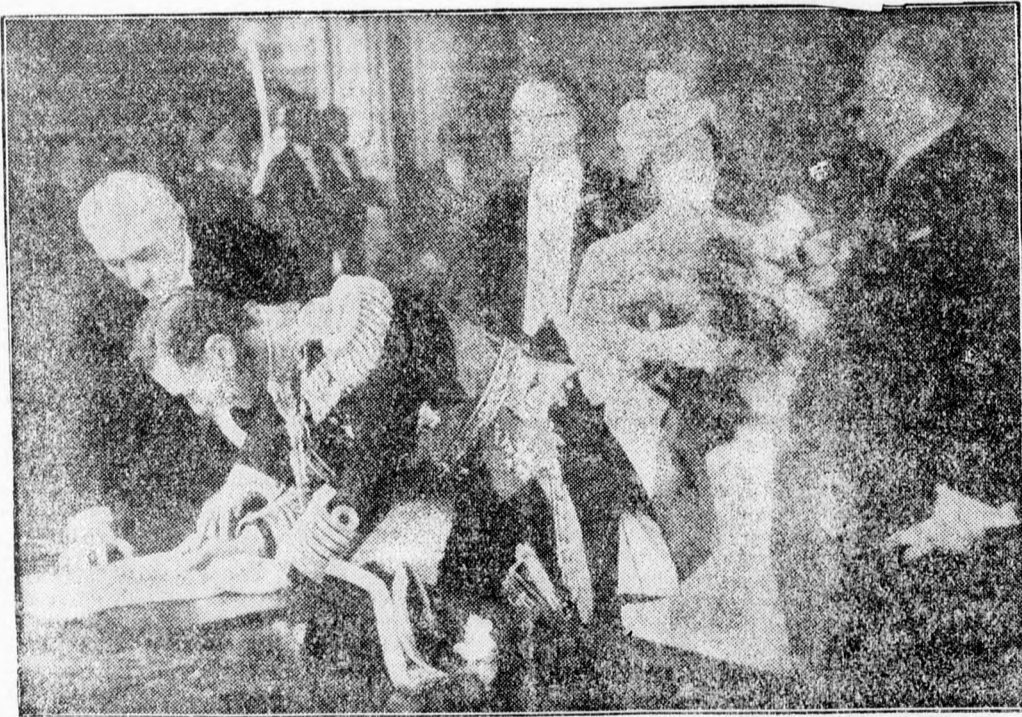
Az angol királyi pár párizsi látogatásakor megtekintette a városházát és az angol király beírta nevét Párizs aranykönyvébe. Képünkön az angol király mögött a királyné és Lebrun főztársági elnök láthatóak.