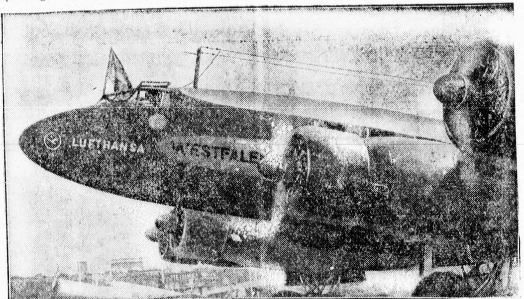
Németország egyik új óriás repülőgépe, a „Condor”, amely négymotoros és nagy távolsági utakra fogják használni.

Ára 264 lei és portó. Singer és Wolfner kiadása.