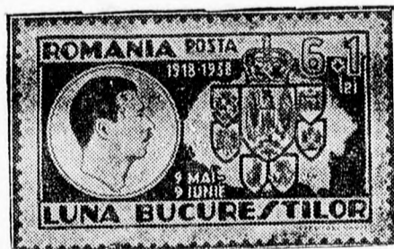
A „Bucuresti Hónap” emlékbélyege. Mint ismeretes, a „Bucuresti Hónap” alkalmából bélyegsorozatot adott ki a posta. Képünkön a Károly-fejes emlékbélyeg látható, amely nagy keresletnek örvendett.

Varsóból jelentik: A lengyel kormány megszüntette a Népszövetség melletti állandó képviselőt. Illetékes helyen hangsúlyozták, hogy ez az intézkedés még nem jelenti azt, mintha Lengyelország kilépett volna a Népszövetségből is.