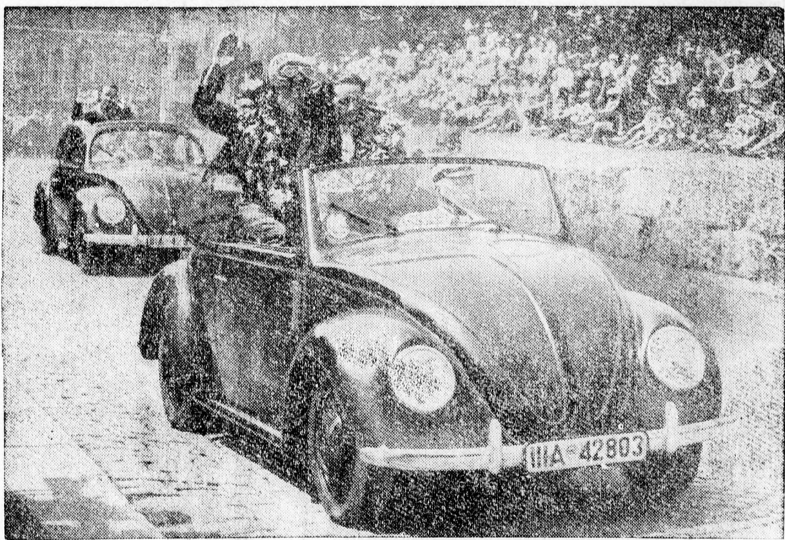
Az új, olcsó német tömegautót most mutatták be, az európai nagydíjért való versenygyőztesei. Ebből a gépkocsitípusból most 300 ezer épül, s az ára igen alacsony. A „nép-autó” — mint képünkön látható — szemre is elég szép.

— Azután a német követség közbenjárására bevagoniroztak, de ugyanakkor figyelmeztettek, hogy ha hazajövök, csak a szintizta igazat valljam. Esküszöm, hogy a tiszta igazat mondtam — fejezte be mondanivalóját Ernst Wilhelm Szeptovszky, aki az Oroszországban eltöltött 16 esztendő alatt mélyégsen megtanulta, mit jelent az a szó: Kommunizmus és mit jelent az a tollal és betűvel le nem írható államrendszer, amit: tanácsköztársaságnak hívnak.