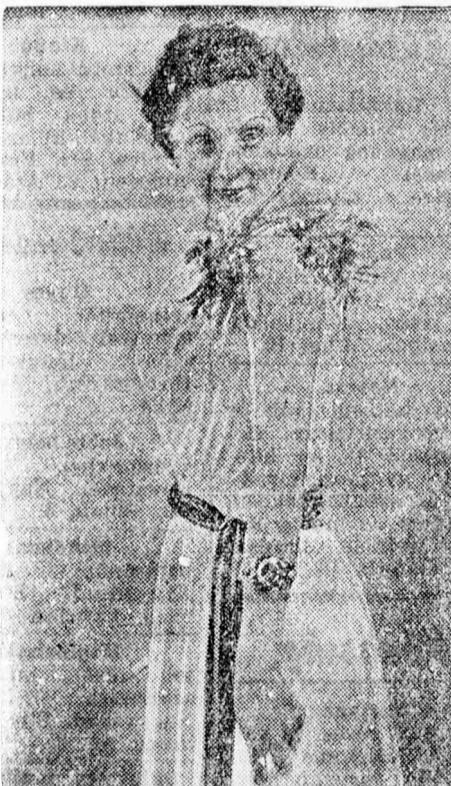
Fehér, könnyű, nyári kisestélyi ruha, sötétvörös hárszínű szalag övvel. A vállat színes virágcsokor díszíti. Fiatal leányoknak is igen alkalmas

Lerakott lecsós rizs. (6 személyre.) Félkiló jó rizst vízen szemesre párolunk. 6 nagy zöldpaprikát megtisztítva és elvágva, zsiron, kevés vízzel puhára párolunk. Negyedkiló paradicsom héját lehuzzuk, felszeleteljük és besózzuk. Mély tűzálló edényt kizsirozunk, lerakunk egy sor rizst, rá egy sor paprikát, megint rizst, paradicsomot, tetejére rizst. Sütőbe tesszük negyedóra, majd megöntözzük negyedliter jó tejfellel. Közben minden személynek egy sertéskarajt hirtelen mindkét oldalán kisütünk és miután a tejfelt ráöntöttük a rizsre, tetejére rakjuk a karajokat, azok tetejére kevés tejfelt öntünk és még 10 percre a sütőbe tesszük. A tűzálló tálban tálaljuk és jégbehűtött uborkasalátát vagy kovászos-uborkát adunk melléje