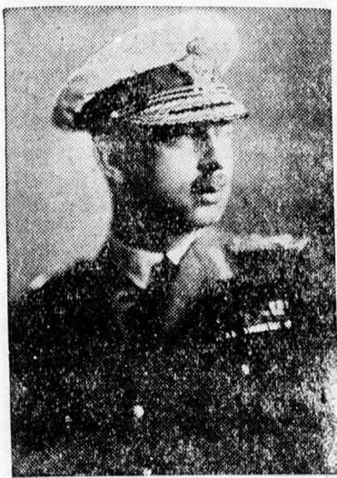
Öfelsége II. Károly király