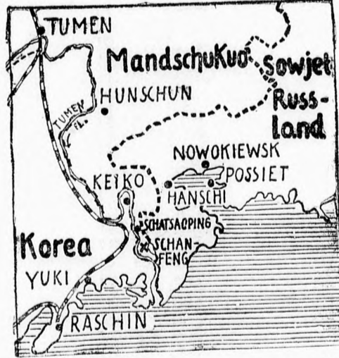
A mandzsuri-koreai és szovjet-orosz határvonal, ahol az új világháború fellobbanásának veszélye fenyegetett.