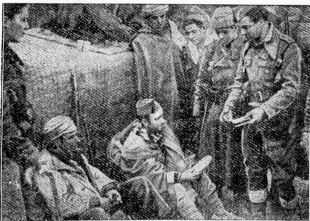
A nemzetiek fogságába került, vagy oda átszökött köztársaságiakat, akik spanyol nemze- tiségűek, Francoék csapatai gyógykezelésben részesítik és élelemmel látják el. Képünkön a nemzetiekhez átszökött köztársaságiak egy kis csoportja látható, amint kenyeret kap- nak Francoék katonáitól

Ebédnél a város helyőrségéhez tartozó tisz- tek magyarázzák meg a dolgot, hogyan tudja a nemzeti hadsereg Huescát tartani. Ennek több magyarázata van. Az első az, hogy a fa- langisták olyan halált megvető bátorsággal küz- denek amelyre alig van példa a spanyol törté- nelemben. A legnagyobb túlerő elől sem vo- nulnak vissza, felveszik a küzdelmet és sem-