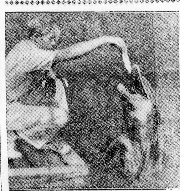
A floridai partok közelében ritkán látható tengeri disznó tűnt fel, amelyet sikerült etetéssel egészen megszéledíteni, úgy, hogy ez a ritka, fenti fényképfelvétel is készülhetett róla.