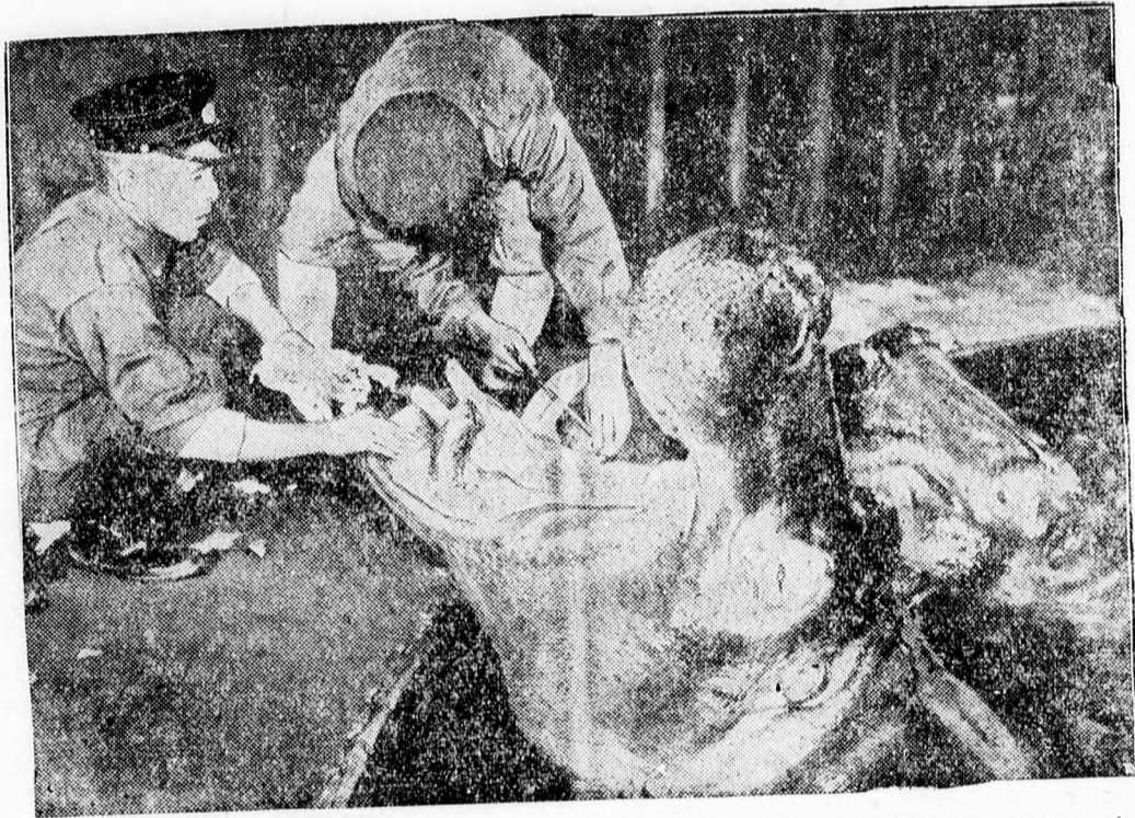
A tokiói állatkertben az egyik viziló súlyos foga peráció esett át, amit békésen türt el. Érdekes képünk operáció közben készült

Messze vezetne, ha elemezni akarnánk azokat az eszközöket is, amelyek a sajtóharcok során alkalmazásra kerültek. A befolyásolás, a rábeszélés, a nyílt fenyegetés, továbbá az elhallgatás vagy a kitalált értesülések halmazása, a fokozatos nyomás, az állandó és megismétlődő rípszok, stb. olyan fegyvertárát kellene elsorolnunk, amelynek tanulmányt kellene szánni. Ez a vázlatos gondolat-sorozat csupán azt akarta szemléltetni, milyen szerep jutott a sajtónak 1920 után s az emberi ész e nagy találmányát milyen cél és gondolat szolgáltatába állította ugyanez az emberi elme. Inter arma silent musae; énekelte a római költő. Amit a mai Európa így fejezett ki a békére vonatkoztatva: Ha nincs fegyvercsörgés, szálljon sikra és harcoljon érettség a nyomtatott betű, a hírlap, a sajtó. A fegyverek egyik legtekélyesebbike, amelyet az emberi elme valaha kitalált.