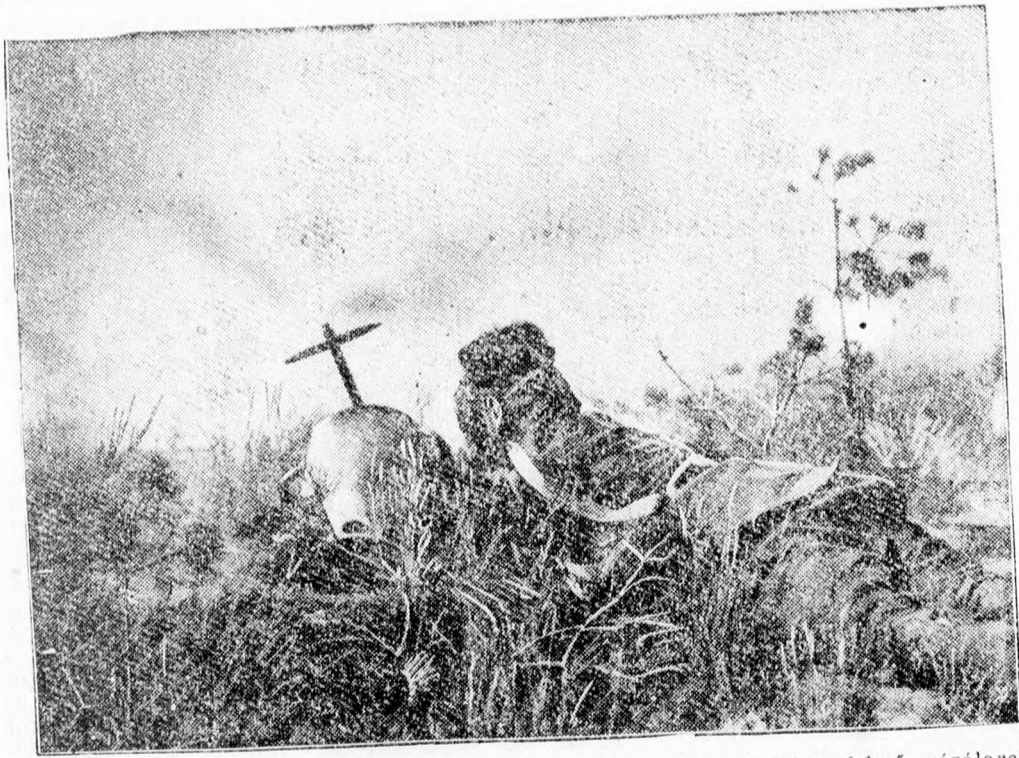
A német hadsereg nagy hadgyakorlatán készült ez az érdekes kép. A fűben fekvő, gázálcross katoná mellett — kódfejlesztő készülék van. A sűrű ködben aztán a gyalogság és a tankok észrevétlenül nyomulhatnak elő.

A rendőr vallatást kezdett és kisült az egész, hogy mi történt. A kisöreg ment az utcán, meglátta a hulladékok szélén a szemébe való, öreg rézkilincset s felvette. Ez az, amelyiket a másik az előbb elvett tőle, értéke semmi. Neki nem is volt rá semmi praktikus szüksége se, nem akarta ő értékesíteni, csak hát meglátta s gondolta, felveszi. Fel. Mert ő már öreg ember s az utcán mindenféle holmit összeszed magának. Csak úgy felveszi és hazaviszi. Van már otthon mindenféle holmija: patkója, ceruzája, gumí cipősarka, kése, dugója, óraszínórja, vasdarabja, gondolta, most lesz kilincse is. Közéjük teszi. Egy skatulyában tartogatja ezeket a dolgokat s néhanapján, mikor esik az eső s a köszvénye nem engedi kimenni, előveszi ezeket a holmikát és elbábráljat velük. Szépen elmegy bábrálgatás közben az idő s észre se