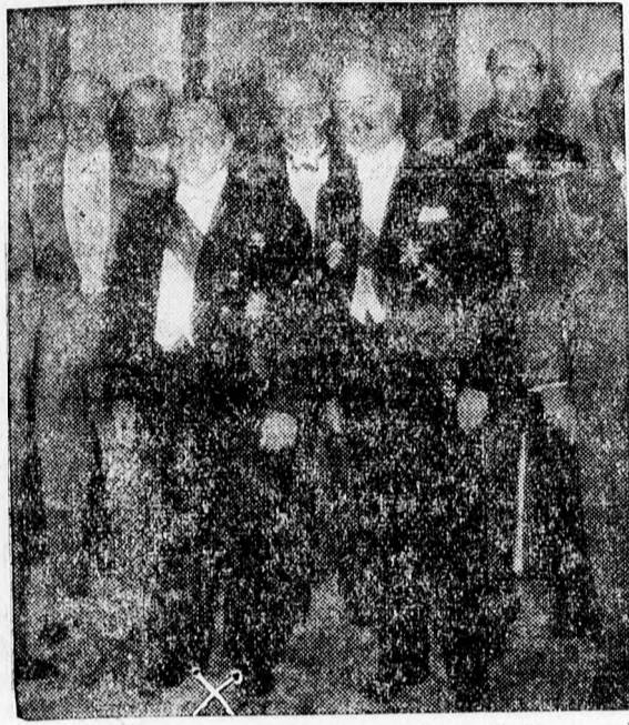
Vuillemin francia légügyi vezérkari főnök az (x) Berlinből való elutazása előtt melegen ünnepelték a repülőtestek estélyén. Képünkön Vuillemin mellett a berlini francia katonai attasé látható.

Gayda a Voce d'Italiában üdvözli a megállapodást, amely megcáfolja azt a beállítást, hogy az Egyház és a fasiszta párt között a faji kérdésben súlyos ellentét állottak volna elő.