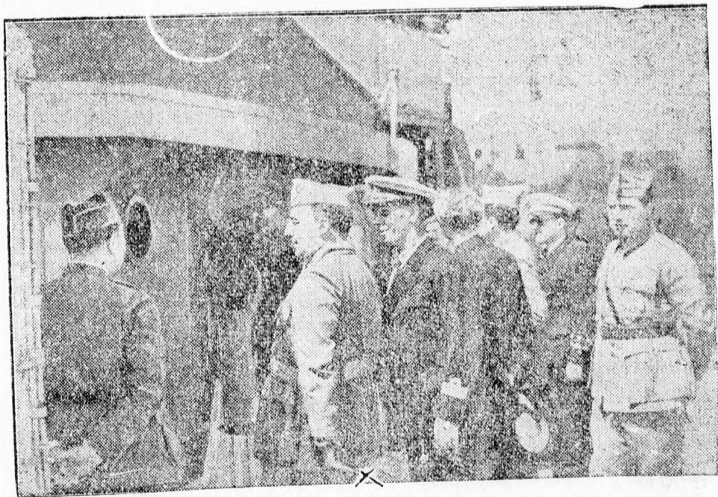
Franco tábornok (x) a Barcelona és Valencia között levő Vinaroz közelében flottaszemlét tartott. Képeink Franco tábornokról egy nemzeti spanyol hadihajón annak megszemlélése közben készült.

No, hatvan tonna bombasúly, azt hiszem, alaposan meg fogja zavarni működésüket.