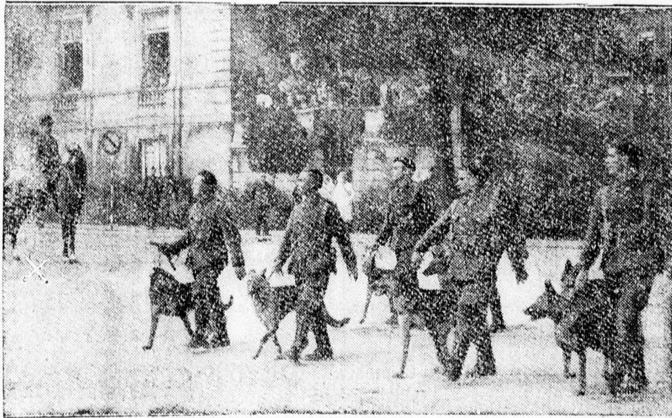
A belga hadgyakorlaton farkaskutyák is résztvettek s a kitűnően idomított kutyák Lipót király (X) előtt is elvonultak díszmenetben.