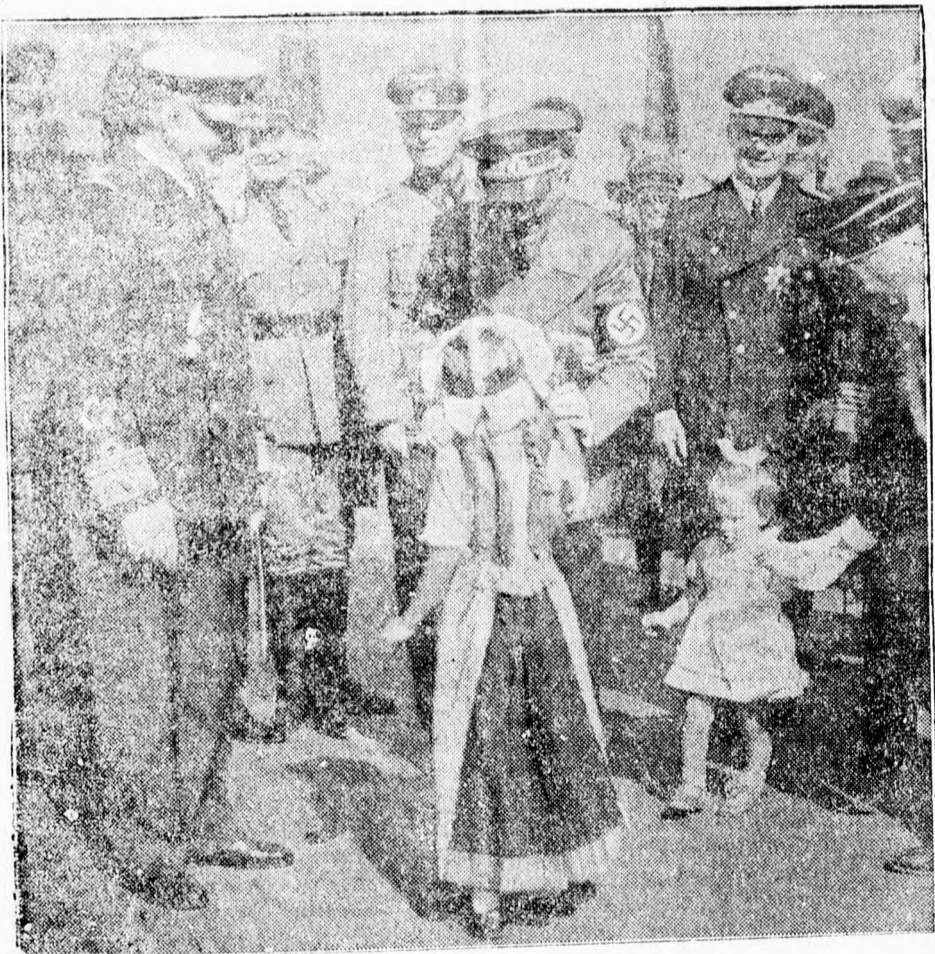
Horthy Miklós kormányzó Helgoland szigetét is meglátogatta. A kormányzó előtt apró gyermekek is elvonultak, helgolandi népviseletben s Horthy Miklós és kísérete szeretettel fogadták a helgolandi gyerekek virágait

Sopronból jelentik: Imrédy Béla miniszterelnök vasárnap délelőtt gépkocsival Sopronba érkezett. Itteni nyaralójában töltötte a vasárnapot, családja körében és hétfőn reggel Budapestre érkezett.