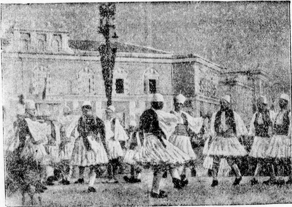
Nemzeti ünnep albániában. Abból az alkalomból, hogy Achmed Zogut tíz évvel ezelőtt proklamálták albánia királyává, Tiránában nagy nemzeti ünnepet rendeztek, amelyen az albán földművesek nemzeti táncokat lejátszottak a királyi palota lótti téren.

25 százalékos kedvezményt kapnak a turista egyesületek tagjai a menedékházakban, Kolozsvár. Saját tud. A fővárosi Turista Szövetség még kora tavasszal felkérte az affiliált turistaegyesületeket, hogy egymásközött viszonyossági alapon a turistaházakban tagjaik részére nyújtsanak kedvezményt. Hosszas tárgyalások eredményeképpen a turista egyesületek között megegyezés jött létre, amely szerint ezeknek tagjai a turista egyesületek menedékházában 25 százalékos kedvezményt élveznek. A Turista Szövetség 10 lei értékű bélyegeket bocsátott ki, amelynek a turista igazolványba való beragasztása biztosítja ezt a kedvezményt.