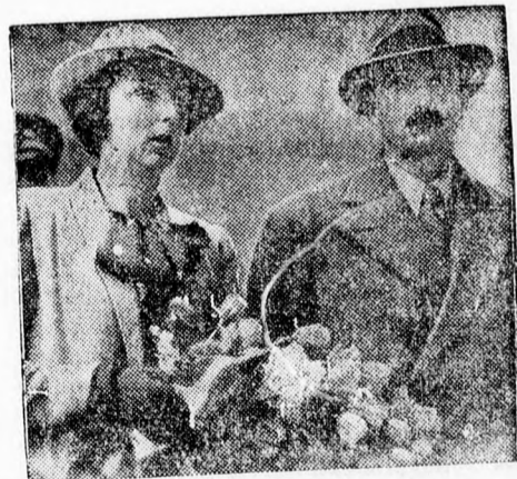
A bulgár királyi pár, Boris király és Johanna királyné az angol királyi pár meghívására Londonba érkeztek.

Teréz hirtelen leejtette kezéből a batyut, amit éppen össze akart kötni. Mondani akart valamit, de nem jött ki hang a torkán. Hát csak elkapta a Kisasszony kezét és megcsókolta.