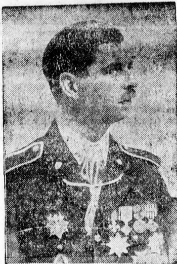
Ófelsége II. Károly király

Ezután Mitita Constantinescu nemzetgazdasági miniszter olvasta fel a Pescarusul és Albatrosul hajók keresztlevelét, majd az ural-