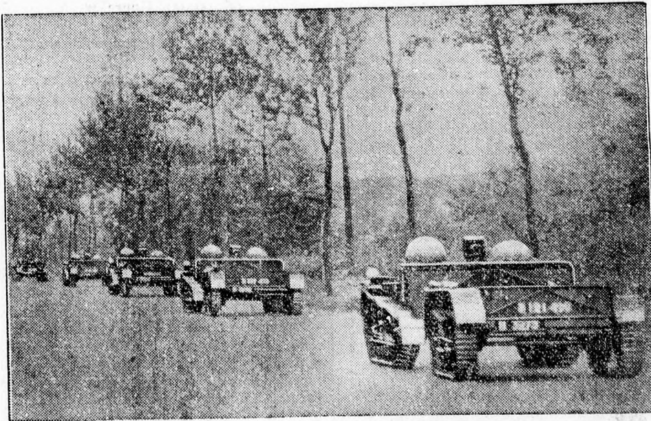
A francia keleti határon — mint ismeretes — magyaránny csapatösszevonások vannak. Képünk egy sor tankszerű francia municiószállító kocsirol készült Strassburg közelében, a híres Maginot-vonalé.

Ismételten közöljük, hogy amennyiben megfelelő számú zárandók jelentkeznek, szeptember 25-én, vasárnap hajnalban is indít a Rendezőbizottság gy különvonatot Nagyváradról, amely a kora reggeli órákban érkezik meg Mária-Radnára. A jelentkezéseket a plébániai hivatalok fogadják el és legkésőbb szeptember 20-ig beküldik a Rendezőbizottsághoz.