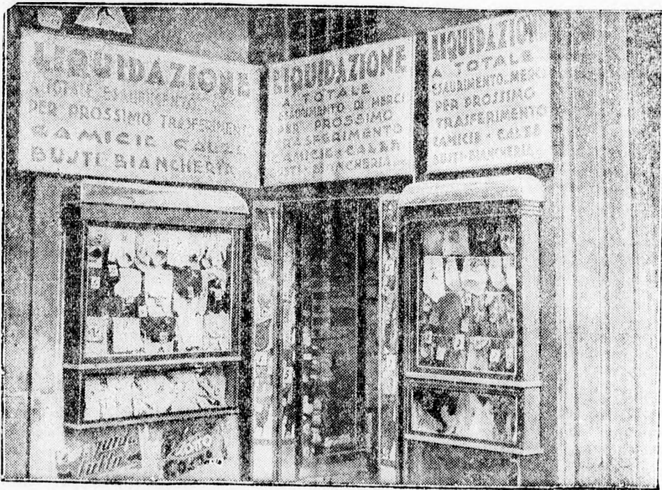
Mint ismeretes, Olaszországban elrendelték, hogy a háború után letelepedett zsidóknak hat hónapon belül el kell hagyni az országot