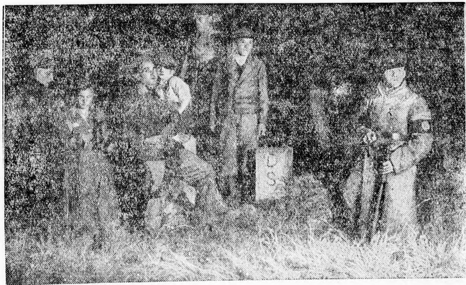
A cseh-német határ Sachsenberg-Georgsthalnál, ahol igen sok szudéta-német lépte át a határt. Képen: a németországi határkőnél készült menekültekről és német határőrökről

A cseh választ az angol kormány csak szerdán vizsgálja át. Chamberlain utazásának 24 órával elhalasztását azzal magyarázzák, hogy a cseh válasz nem kielégítő és az angol kormány tanácskoznia akar Prágával. A Press Association szerint a cseh kormány válasza udvarias hangú ugyan, de ténylegesen az angol-francia javaslat elutasítását jelenti. A cseh kormány a döntést nyilván a házái döntőbírótság elé akarja vinni. Tekintettel arra, hogy Hitler követelése az, hogy a további diplomáciai tárgyalások ne legyenek, a helyzet kényes és a feszültség növekedett. Chamberlain szerdán még tanácskozik a kormány és a külügyi hivatal tagjaival.