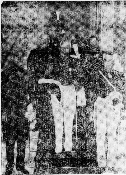
A hollandi parlament záróülése után távoznak a miniszterek a parlament épületéből