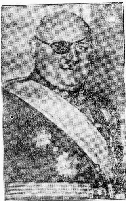
Syrový tábornok, a csehszlovák kormány új elnöke

Londonból jelentik: A Central News megbízható értesülésre hivatkozva közli, hogy a cseh kormány Prágából az ország másik részébe helyezi át székhelyét, mivel a jelenlegi főváros csak 50 mérföldnyire van a német határtól. Az erre vonatkozó hivatalos közlés rövidesen várható.