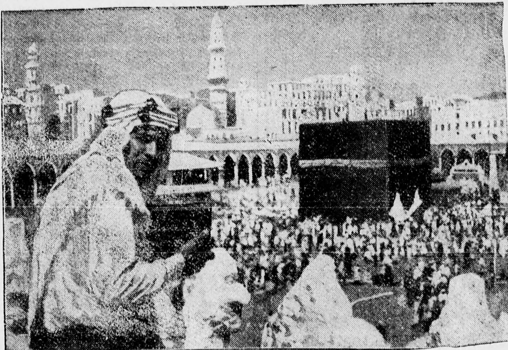
Első filmkép Mekéből, a mohamedánok szent városából, ahol mostanáig senki sem lényképezhetett. Hedzsasz királya most egy filmtársaságnak csak azért engedélyt a Mekében történő hangosfilmfelvételekre, mert a filmexpedíció minden tagja mohamedár. Képünk az ősi város egyik igen szép részletét ábrázolja

A L. A. R. E. S. társaság működésére és a technikai személyzet ügyességére és megbízhatóságára jellemző, hogy ez alatt az idő alatt egyetlen baleset sem történt. A román repülés tehát elérte azt a szintet, amelyen a külföldi államok kereskedelmi repülése áll.