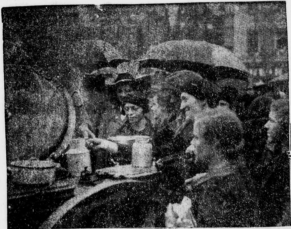
A német hadsereg után mindenütt bevonultak a szudéta vidékekre a népkonyhák is (magyarul gulyásagynak hívják az ilyen leveskiosztókat) s megkezdtek a kiegészített nép élelmezését. Képünk az első „egyfazekas” ebédkiosztásáról készült

Közhivatali ügyvédek, tiszti-ügyészek, polgármesterek, polgármesterhelyettesek, állami iskolák tanárai, szakkamarák elnökei nem folytathatnak majd ügyvédi gyakorlatot. Az ügyvédi-talár viselése kötelező lesz minden kategória számára.