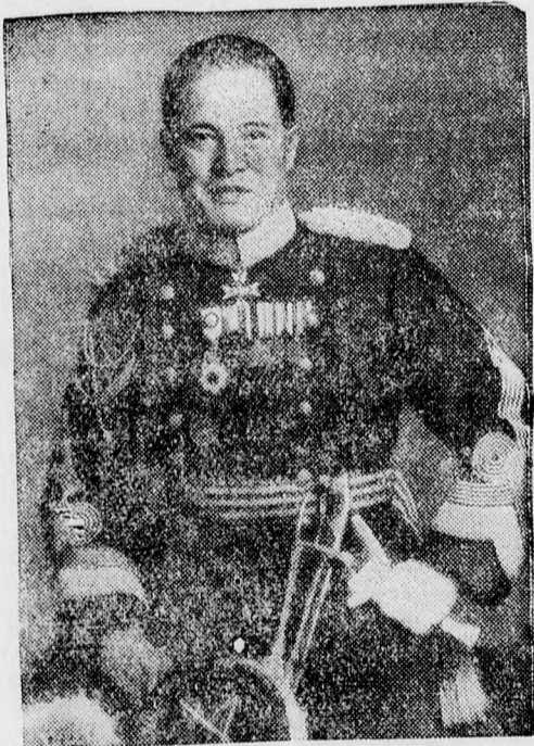
Japán új németországi nagykövete, Hirosho Oshima, megrkezett Berlinbe

A városházán úgy segítenek ezeken a szegényeken, hogy ideiglenesen segélyben részesítik őket. A segélyösszeg indokolt esetben megfelel a régi és az új lakber közötti különbözethez. Sajnos ez a mód nem jelent tartós megoldást, a kiköltöztetett nincstelenek elhelyezése tehát függő kérdés marad. Problémát képez ezenkívül az is, mivel lehetne kárpótolni azokat a „háztulajdonosokat”, akiknek viskóit a közegészségügy érdekében a lehető legrövidebb időn belül le kellene bontatni, a hatóság javaslata értelmében.