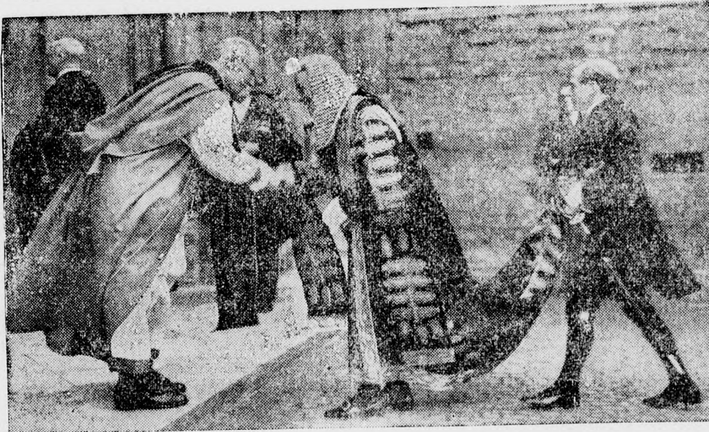
London főbírája tradicionális viseletben a törvényszék megnyitása előtt a Westminster-apátságba megy a megnyitói istentiszteletre. Az apátság előtt teljes díszben, hagyományos ceremóniák között fogadja az apátság dékánja