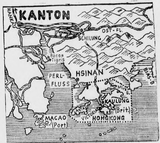
A japán-kínai harcok teljes erővel tartanak Kantonban

ternyire állnak Kantontól és 75 kilométernyire Hankautól.