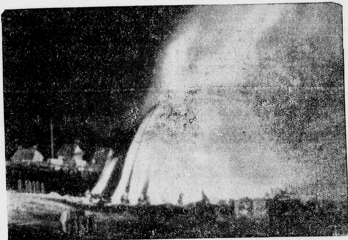
„Engyel Csillag” nevű stratosféra léggömb a chocholovi repülőtéren, ahonnan a stratosféra-utazók való startja készült, felrobbant. Képünk az égő ballonnól készült

Anglia szempontjából talán a legfontosabb állomás Washington. Ennek nagykövetségét a hosszú diplomáciai szolgálattal rendelkező Sir Ronald Charles Lindsay vezeti. Ennek a 61 éves, nagybajuszú, barátságos mosolyú angol úrnak megvan az a nagy „előnye” is, hogy kissé — nagyot hall. Így azután, ha valami kényes kérdésre kell feleletet adnia, előbb udvariasan megismételteti a kérdést. Közben mérlegelheti a válaszait. Azonkívül mindenkire „lenéz”, mert ő a legmagasabb termetű az angol diplomaták között. Kényes helyzetben bizonyos fölényt ez is nyújt.