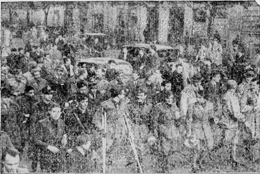
Hazatértek a spanyol határról az olasz önkéntesek. Ez a kép a Milanóba bevonuló önkéntesek egy csoportjáról készült.

Rómából jelentik: Az olasz sajtóban a Messagera a bécsi döntést úgy méltatja, mint az igazság nagy győzelmét. Világtörténelmi jelentősége van, mert békés jóvátétellel rendezett egy alapjában hibás helyzetet. A Popolo di Roma hangoztatja, hogy maguk a magyarok sem számíthattak ilyen sikerre, de a csehek és a