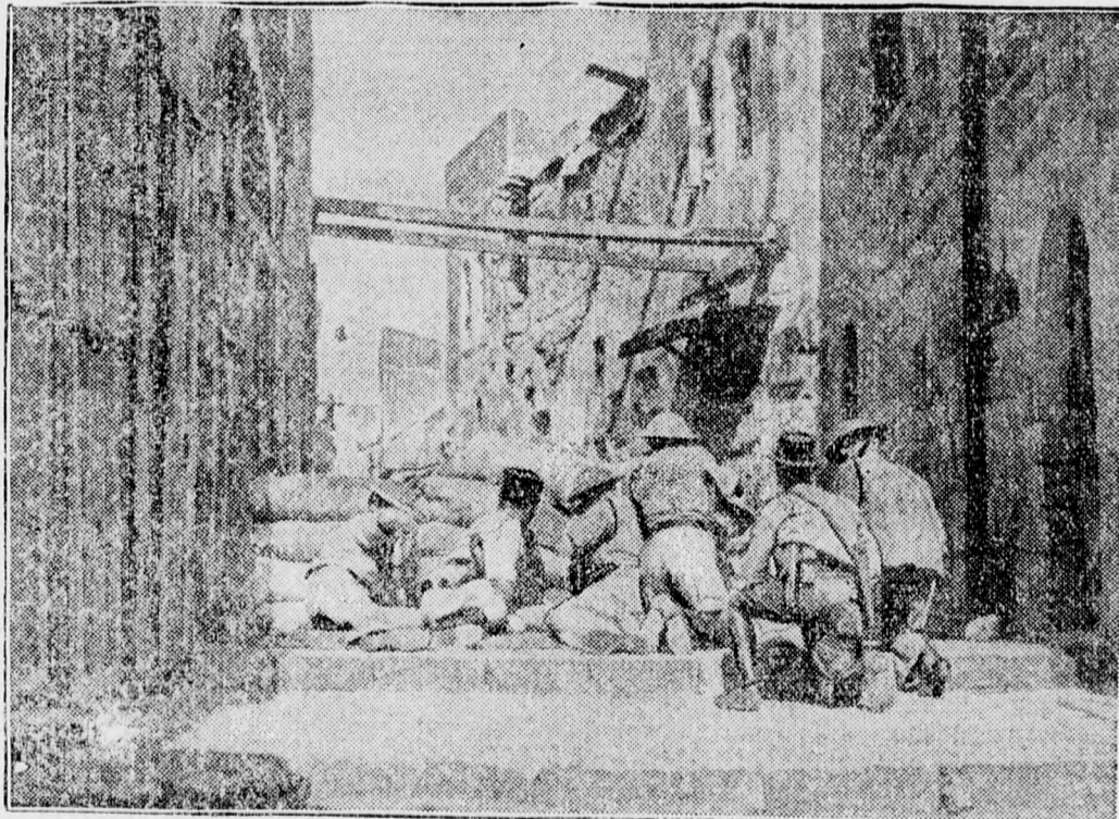
Barrikád Jeruzsálam óvárosában, ahol az arabok és az angol katonák véres harcokat vívtak.

Dorian: „FÉRJFOGAS“. Főszerepben: Loretta Young.