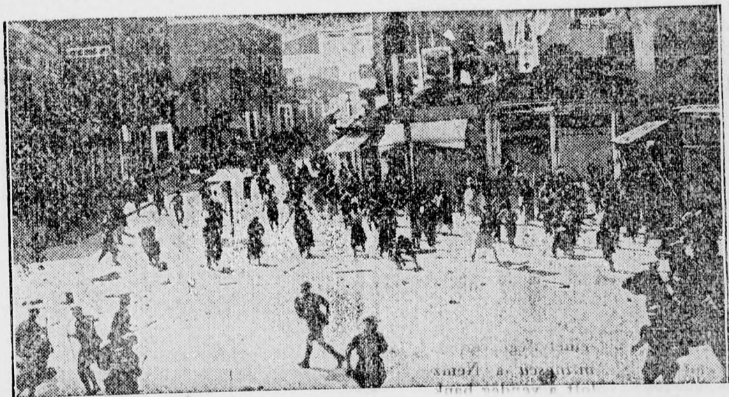
A marseillei tűzvész borzalmassága csak most kezd kibontakozni teljes mértékében. Ezen a képen egyik leégett hatalmas palota romjai láthatók. A romok alól 67 halottat húztak ki

Budapestről jelentik: A Magyar Nemzeti Bank ideiglenesen 5 pengős bankjegyeket bocsát ki, nehogy a felvidéki visszacsatolás folytán a cseh korona átváltásában pénzforgalmi nehézségek álljanak elő. Bár a pénzverde éjjel-nappal dolgozik, a kívánt időre aligha tud elkészülni a szükséges mennyiségű ezüstpénz érmeikkel. Annint azonban a kívánt mennyiségű ezüst ötpengős érme rendelkezésre áll, a bankjegyeket kivonják a forgalomból. Ez legkésőbb január végéig meg fog történni.