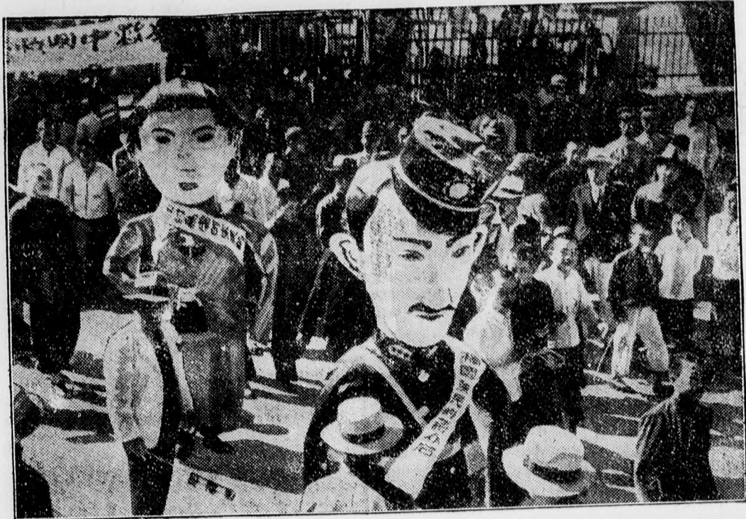
A japánok által megszállott Tsinan városában nagy felvonulást rendeztek, Csang-Kai-Sek ellentüntetésül. A felvonuláson a marsall és felesége életnagyságúnál nagyobb karikatúrát hordoztak körül a városban. Távolkeleti ízlés...