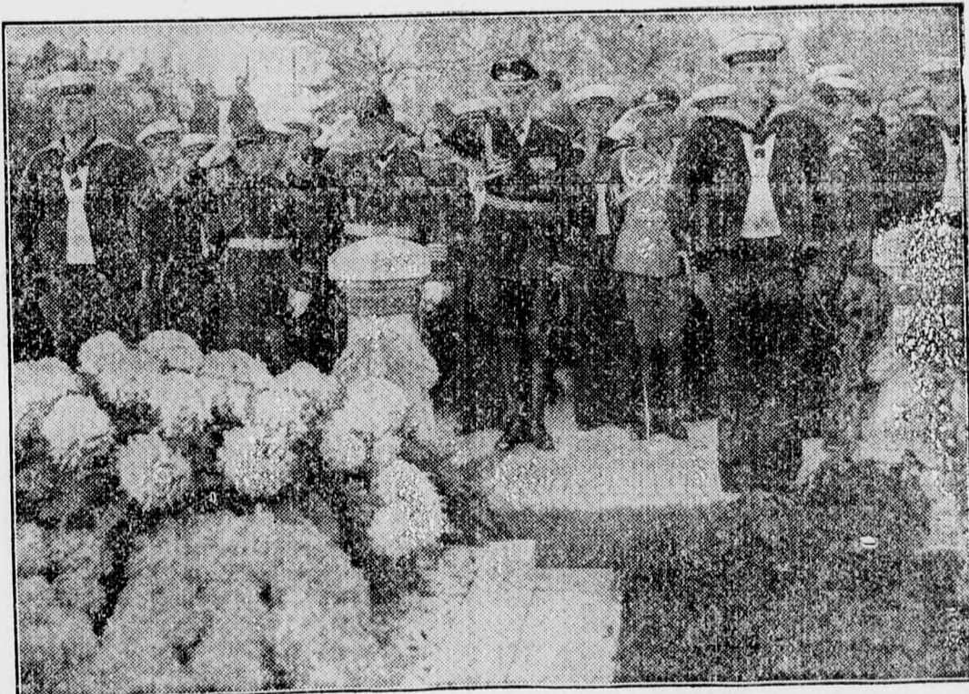
Az „Emden” német csatahajó tisztikara és legény ségi küldöttsége megkoszoruzta Bucurestiben az Ismeretlen Katona sírját. Az Emden csatahajó már eltávozott Constantából, ahol egy hétig volt látogatásban

Hétfőn este 9 órakor: Légy enyém mint régen. (Bucsuelőadás.)