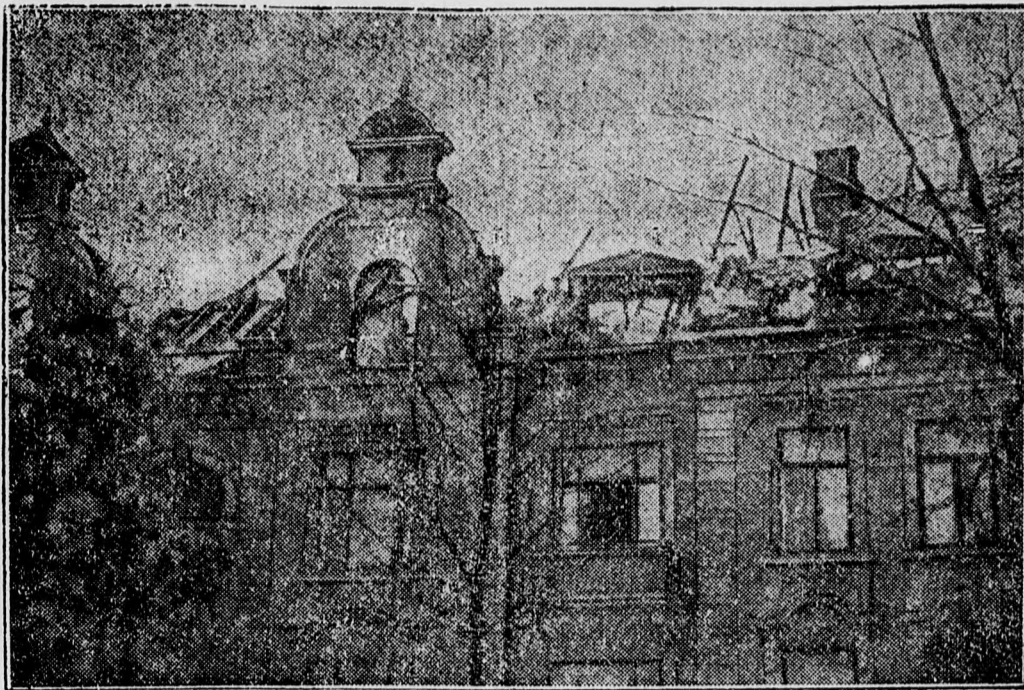
Megirtuk, hogy Oslóban hatalmas tűz pusztított és pár perc alatt harminc ember lelte halálát. Képzünk az ismeretlen okból keletkezett tűzvész által elpusztított házat ábrázolja

Ez a karaván meg is érdemli a nevét. A ropant gépkocsi közül a négy leghatalmasabbikat úgy állították fel, hogy jókora négyszög, két hosszabb párhuzamos oldalt írtak le vele, nagy térséget fogva közre. Aztán vastraverzek, acéllemezfalak, emelvények, ponyvák, széksorok, lép-