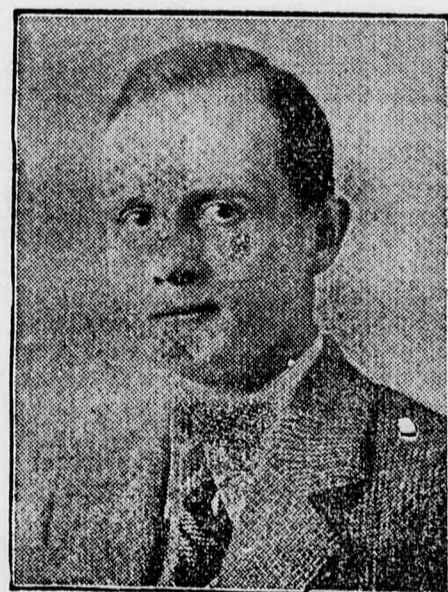
Von Rath, párizsi német követségi titkár, akit mint ismeretes, egy Herschel Siebel nevű ember revolverlövésével halálosan megsebesített.

Párizsból jelentik: Flandint, hétfőn a Névtelen Katona sirjánál, ahol a demokrata szövetség vezetőségének kíséretében koszorút helyezett el, egy Renuvin nevű ügyvéd megtámadta és kétszer arculütötte. A rendőrségnek kellett beavatkoznia és az ügy további elmérgesedését megakadályoznia.