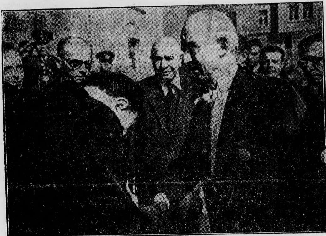
Ismet İnönü, a török köztársaság elnöke, röviddel megválasztása után fogadja a török parlament tagjainak üdvözlését.

AZ ALBÁN KIRÁLY NÖVÉREI KÜLFÖLDI UTON. Koppenhágából jelentik: Az albán király három huga: Myzejen , Ruhije és Madzside hercegnők Brüsszélből jövet Koppenhágába érkeztek. A hercegnők magánlátogatáson vannak és néhány napig maradnak a dán fővárosban.