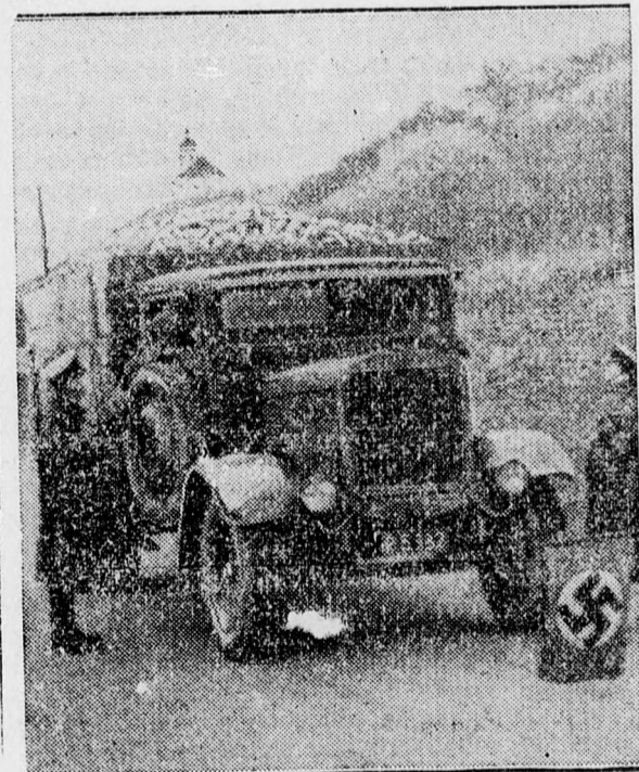
Az új német-csehszlovák határ, egy orszaguton, ahol kifeszített sodronyon lengő zászló jelzi a határt, ahol épp határőrök vizsgálják meg egy tehergépkocsit

A Lengyel Távirati Iroda prágai jelentése szerint a kárpátorosz helyzet egyre több aggodalmat okoz Prágának. Napról-napra érkeznek Prágába a hírek a véres eseményekről, amelyek főleg abból keletkeznek, hogy kíméletlenül elszedik a lakosságtól az élelmiszert és a lakosság vezetőit összefogdoszák. A prágai kormányhoz érkező jelentések beszámolnak arról is, hogy a kárpátorosz falvak megbízottai a magyar hatóságokhoz fordultak védelemért és segítségért, hogy megszabaduljanak az ukrán terroristák kegyetlenkedéseitől és zsákmányolásától. Hozzáteszi a Lengyel Távirati Iroda jelentése, hogy a cseh uralom alatt maradt kárpátorosz területen a városokban és községekben éjjel-nappal katonai járőrök cirkálnak. Este nyolc óra után sem a falvakban, sem a városokban senkinek sem szabad az utcán tartózkodni.