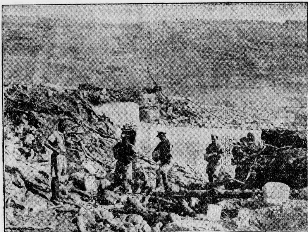
Nablus galileai város romjai, ahol az angolok újabb arab lázadást vertek le. Hatvan ház pusztult el a véres harcok alatt.