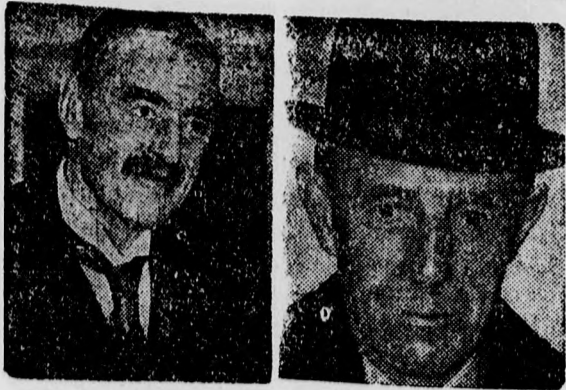
Chamberlain és Halifax

Franciaországba érkeztek, ahol az angol kormány megbízásából folytatnak tárgyalásokat.